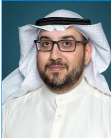
النائب أسامة الشاهين

وأدعو الله لكم مزيدا من النجاح والتقدم والتوفيق. كما ارسل الشيخ مشعل مالك محمد الصباح تهنئة إلى أسرة «الوسط» بمناسبة عيدها الحادي عشر قال فيها: يطيب لي أن أبعث اليكم بخالص التهنئة والتبريكات بهذه المناسبة العزيزة بذكرى مرور 11 عاما «الوسط» الموقرة ، ويسرني بهذه المناسبة الطيبة أن أعرب عن تقديري واعتزازي بالمستوى الإعلامي المتميز الذي اتسمت به جريدة الوسط الغراء .