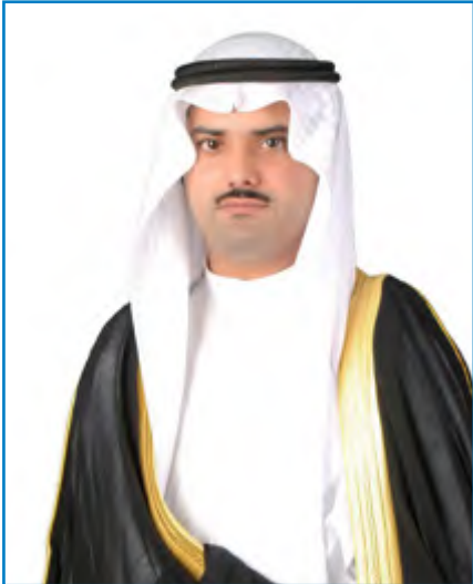
الشيخ مشعل الصباح

◆ السفارة القطرية: الوسط علامة بارزة في العمل الصحفي الهادف