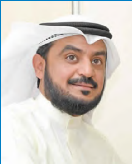
النائب محمد الحويلة