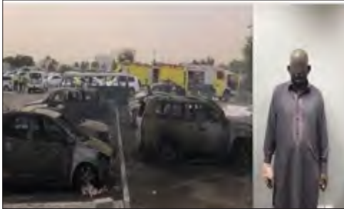
مفتعل حريق دبي

بعد إلقاء القبض على مفتعل حريق أو ثلاث مول في دبي من قبل الشرطة، اعترف المتهم الذي أصيب بحروق طفيفة في يديه بالسبب الذي دفعه إلى ارتكاب هذا الجرم، الذي تسبب باشتعال 11 سيارة يوم السبت.