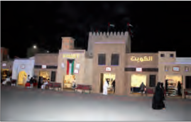
الحي التراثي الكويتي في مهرجان الشيخ زايد للتراث

لمصادر الرزق في مجال الغوص واقتناء اللؤلؤ وصيد الأسماك ونقل البضائع والسفر والتجارة البحرية..