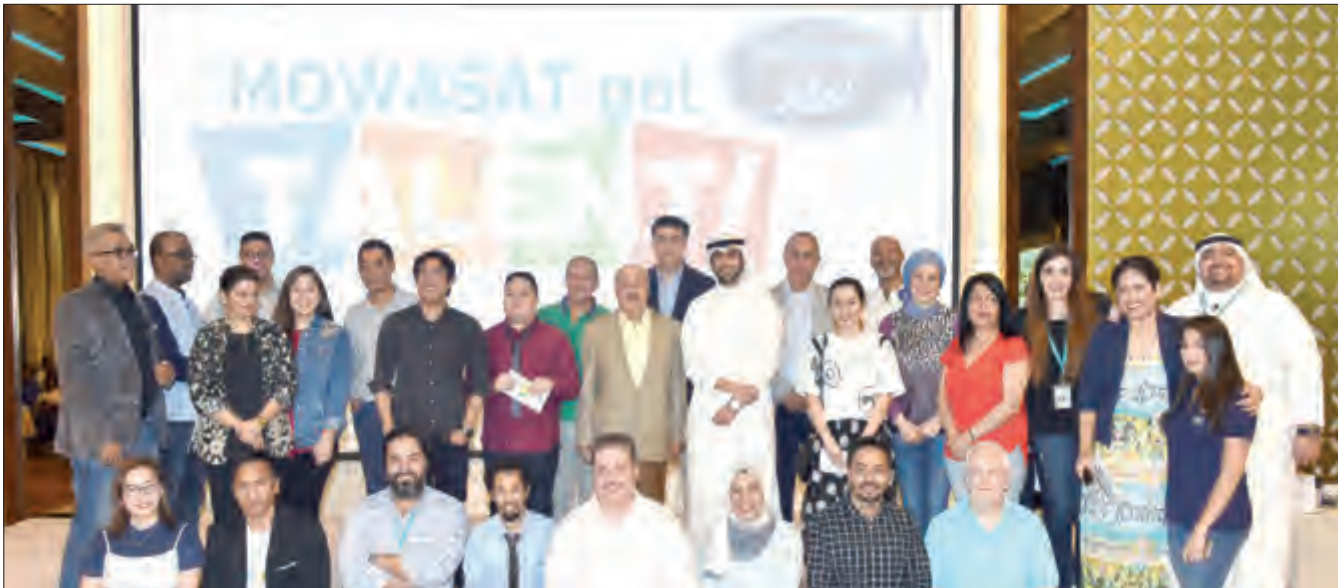
المدير التنفيذي متوسطا المكرمين

البادرة مؤكدين أن تلك البادرة الطبية تشكل حافزاً قوياً لمواصلة أداء أعمالهم بكل تفان وإخلاص. ويعد مستشفى المواساة الجديد أول مستشفى متكامل للرعاية الطبية المتميزة على مستوى القطاع الأهلي في الكويت، كما أنه أول مستشفى حاصل على