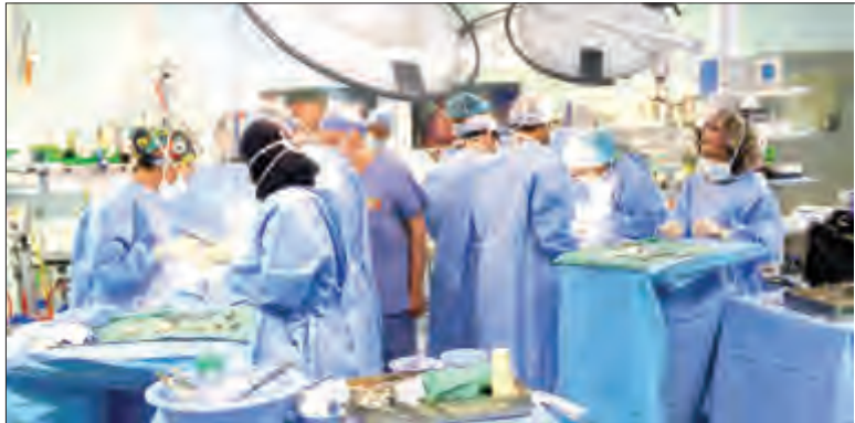
جانب من عملية فصل التوائم السوداني

للتوائم بمشاركة جميع أعضاء الفريق الطبي والجراحي لعمليات فصل التوائم السيامية، وبعد العملية أكد رئيس الفريق الطبي والجراحي الدكتور عبدالله الربيعه أن ما تحقق من إنجاز هو لوطن، مؤكداً أن هذه «العملية تعد العملية الرابعة والأربعين لعمليات فصل التوائم السيامية التي تجرى في المملكة.