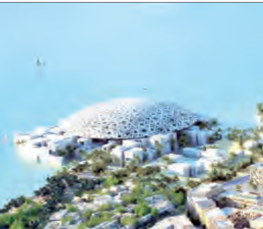
متحف اللوفر في أبوظبي

يفتتح متحف اللوفر في أبوظبي أبوابه للجمهور يوم السبت المقبل 11 نوفمبر الجاري، وقد تم تنظيم جولة صحافية صباح أمس الثلاثاء لمطلي وسائل الإعلام المحلية والعربية والعالمية الذين أطلعوا على أركان المتحف المؤلف من 55 مبنى منفصل و 23 قاعة عرض وقاعة للمعارض المؤقتة ومتحف للأطفال، ومسرح يشمل 200 مقعد. وأضافت صحيفة «البيان» الغماراتية أن المتحف الذي يقع في المنطقة الثقافية في جزيرة السعديات، جاء ثمرة اتفاقٍ دولي بين حكومتي أبوظبي وفرنسا