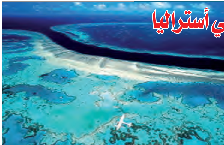
الحاجز المرجاني العظيم في أستراليا

يحاول الكثيرون ترك عادة التدخين السيئة ولكن معظمهم يفشلون في بلوغ الهدف المنشود فيما أوجد العلماء الحل الناجع وتفيد Science Alert بأن علماء الأعصاب في جامعة روكفلر بمدينة نيويورك، تمكنوا من تحديد مجموعة الخلايا العصبية الحساسة في الدماغ والسببية للتعلق بالنيكوتين، وإن كبح نشاط هذه الخلايا يؤدي إلى تخفيض هذه العلاقة جدا ما يمنح المرء فرصة الإقلاع عن التدخين. واستخدم العلماء في بحثهم فئران اختبار تعرضت إلى مادة النيكوتين المذابة في ماء الشرب. ترتبط بالنيكوتين المنطقة الوسطى ونواة انتريونكولار Interpeduncular في دماغ الإنسان حيث توجد في الخلايا العصبية لهاتين المنطقتين مستقبلات بروتينية ترتبط بالنيكوتين عند دخوله مع الدم إلى الدماغ.