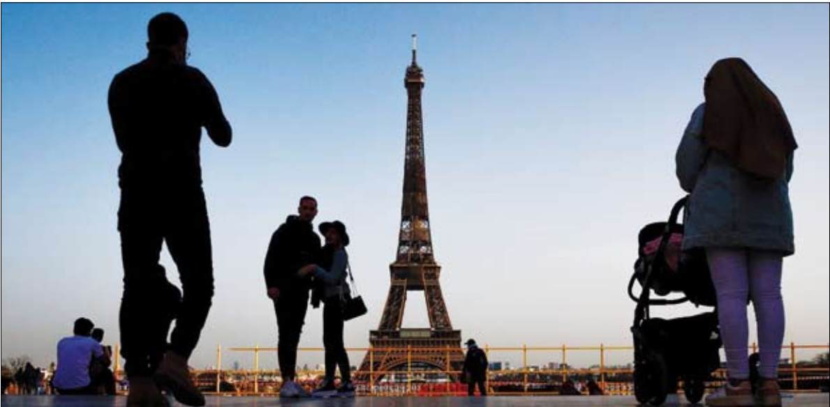
تجمع العديد من الزوار أمام برج إيفل لحظة الغروب

برج ایفل یعاود استقبال الزوار بعد توقف 8 أشهر بسبب كورونا