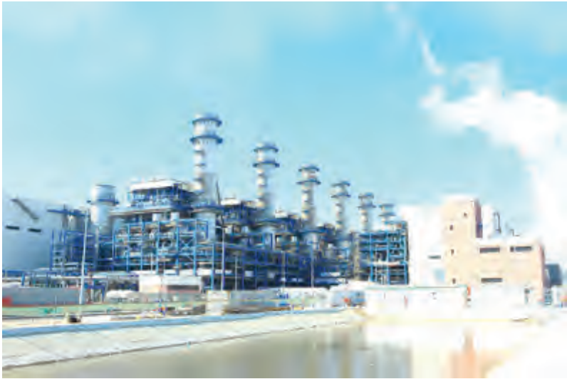
جنرال تستكمل عمليات التحول الرقمي في محطة الصبية

الشركة في الدولة “مركز جنرال إلكتريك للتكنولوجيا” الذي يقدم خدماته ضمن ثلاثة مجالات لعملاء قطاع الطاقة في الشرق الأوسط وشمال أفريقيا: التدريب، ومركز الأدوات، والهندسة. وتعمل تقنيات “جنرال إلكتريك” على تزويد أكثر من ثلث الطاقة المنتجة في الكويت، كما ساهمت الشركة في توفير أكثر من 250 فرصة عمل في الدولة.