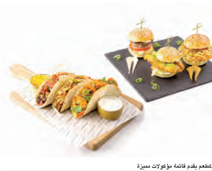
للمطعم يقدم قائمة مأكولات مميزة

تتوفر قائمة “لايت بايتس” بدءاً من 5 يوليو وحتى نهاية شهر أغسطس، ما يسمح لزبائن المطاعم بالتذوق بكل ما هو جديد لدى دين ديلوكا، الأفنيوز.