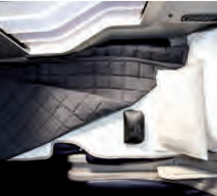
الخطوط البريطانية تقدم فرص مميزة للمسافرين

وفي هذه المناسبة، قال اليكس كرون، الرئيس التنفيذي ورئيس مجلس إدارة الخطوط الجوية البريطانية: “بدأنا استثمارنا في درجة رجال الأعمال ‘كلوب وورلد’، حيث يشارنا بمساعدة عملائنا للاستمتاع بتجربة نوم مريحة في أحضان السماء. ويعتبر تعاوننا مع شركة ‘ذا وايت كومباني’ المرموقة في بريطانيا أفضل أسلوب لها المميز ومستويات الجودة التي توفرها. الخطوة الأولى ضمن العملية الاستثمارية التي تقتر قيمتها بالملايين وتوفر لعملائنا المميزين تجربة استثنائية”.