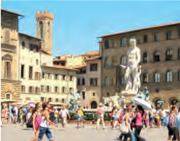
إيطاليا تنتشل بنك إم.بي.إس من العراق

التي طالبت المفوضية الأوروبية بها في موافقتها الأولية على الخطة في أول حزيران يونيو الماضي، ومنها تأكيد البنك المركزي الأوروبي قدرة البنك الإيطالي سداد التزاماته وحصول إيطاليا على تأكيد رسمي من مستثمرين في القطاع الخاص بأنهم سيشترون القروض المشكوك في تحصيلها لدى بنك “إم.بي.إس”.