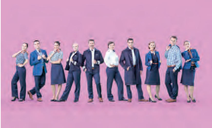
زي جديد لموظفي فلاي دبي

فلاي دبي بما فيها اختلاف المناخ والتنوع الثقافي والديني والمتانة، والتطبيق العملي، والتنوع، وكفاءة التكلفة، فضلاً عن مراعاته لأنظمة الأمن والصحة والسلامة.