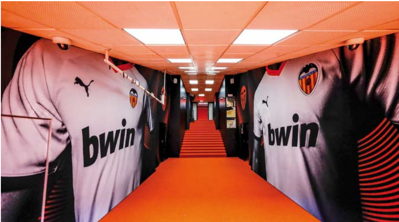
فيروس كورونا يضرب فالنسيا

ومثل دول كثيرة حول العالم أوقفت إسبانيا جميع منافسات كرة القدم لمدة أسبوعين على الأقل للحد من انتشار الفيروس. وإسبانيا هي الدولة الأوروبية الأكثر تضررا بالفيروس بعد إيطاليا. ومنذ يوم السبت تخضع إسبانيا لإغلاق جزئي في إطار حالة طوارئء لمدة 15 يوما فرضتها السلطات بهدف مكافحة العدوى. وبسبب الفيروس توفي حتى الآن 196 شخصا في إسبانيا إضافة إلى إصابة نحو 6400 بالعدوى.