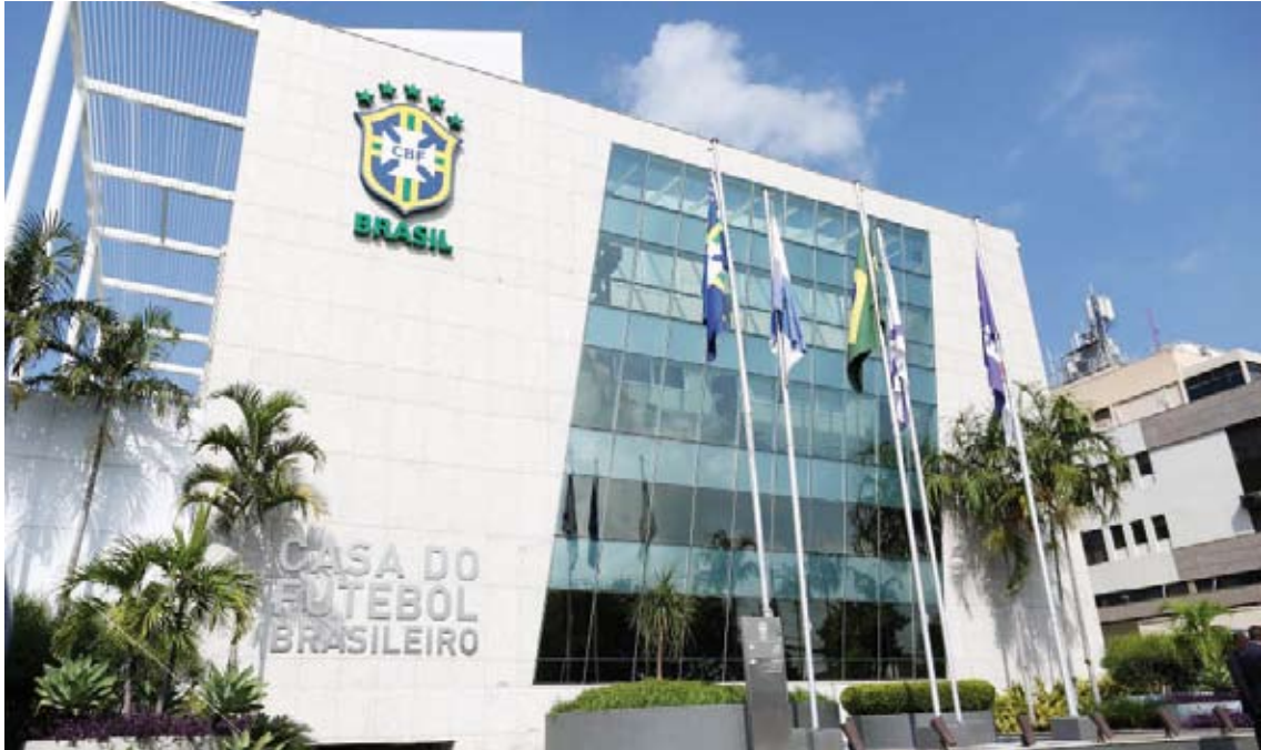
الاتحاد البرازيلي لكرة القدم

في حالة عدم اتخاذ السلطات أي إجراء فإن الأندية ربما يتعين عليها التحرك. وأضاف بورتالوبي «العالم بأسره توقف، إلا يجب أن نتوقف كرة القدم البرازيلية أيضا؟ «هذه هي رسالتنا وأتمنى أن يستمعوا إلينا، أتمنى أن ينتصر المنطق».