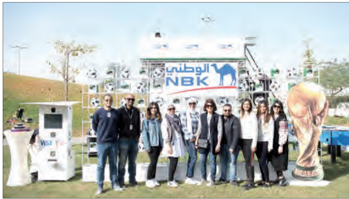
فريق العلاقات العامة في الوطني

في إطار حرصه على تشجيع ودعم المبادرين الشباب وإشراكهم في تنمية الاقتصاد الوطني، شارك بنك الكويت الوطني في الموسم الخامس لمعرض "سوق قوت" الذي استضافته حديقة الشهيد يوم السبت الماضي ويهدف إلى تقديم فرصة حقيقية للشباب الكويتي لعرض منتجاتهم المحلية، وباتى ذلك انطلاقاً من سعي البنك إلى التواصل مع فئة الشباب تحديداً، ليبقى قريباً منهم ومطلعاً على متطلباتهم واحتياجاتهم.