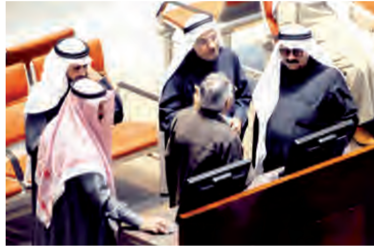
جانب من تداولات البورصة

أنهت بورصة الكويت تعاملاتها امس الاثنين على انخفاض مؤشرها السعري 6,4 نقطة ليصل إلى مستوى 6498ر4 نقطة بنسبة انخفاض بلغت 0,1 في المائة.