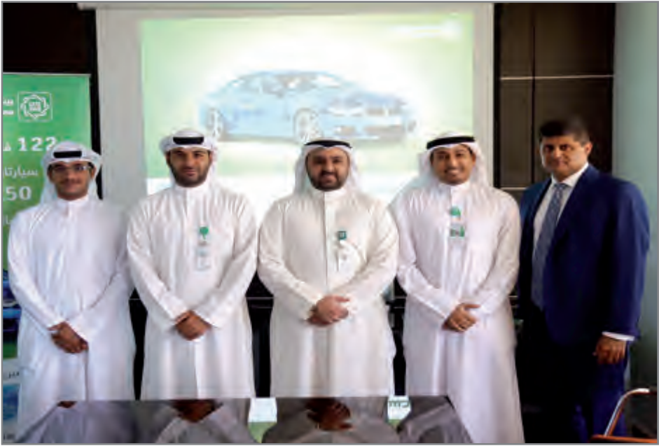
ممثلو بيتك على هامش السحب

ومن أهم المزايا التي يتم تقديمها ضمن برنامج «حسابي» للشباب هي حصول عملاء شريحة الشباب على بطاقة «حسابي» للسحب الآلي (ATM) ذات تصميم شبابي مميز، بالإضافة إلى تمكينهم من الحصول على بطاقة «حسابي» مسبقة الدفع وفق الضوابط الائتمانية لـ «بيتك»، والتي يمكن استخدامها تماما مثل البطاقة الائتمانية لحجوزات الفنادق والطيران عالميا عبر الإنترنت، واستخدامها في أجهزة الدفع (P.O.S) في المحلات التجارية، بالإضافة إلى العديد من العروض التي يتم تقديمها بشكل متواصل وباكثر من مجال، حيث يتم تقديم خصومات كبيرة في مجموعة مختارة من أشهر وأهم المتاجر والمحلات التي تباع السلع والمنتجات الخاصة بالشباب.