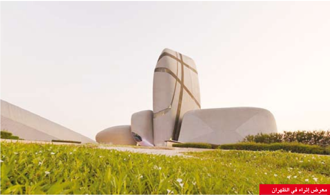
معرض إثراء في الظهران

التواصل بين الناس من خلال الثقافة، وتبادل الأمور المشتركة بيننا. يشار إلى أن المعرض جاء بدعوة مفتوحة لعشاق الفن في جميع أنحاء العالم، وقد تم تلقي المئات من المشاركات، اختيرت منها 270 مشاركة. كما تؤكد المواضيع على مشاركة التجارب التي تضمنت الحظر الكامل والتباعد الاجتماعي وارتداء أقنعة الوجه والعمل من المنزل.