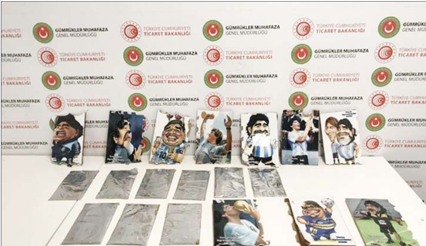
ضبط المخدرات أمام لوحة مارادونا

ضبطت سلطات مطار إسطنبول الدولي، أمس، أكثر من 2 كيلو غرام من مادة الكوكايين المخدرة بحوزة مسافر ألماني.