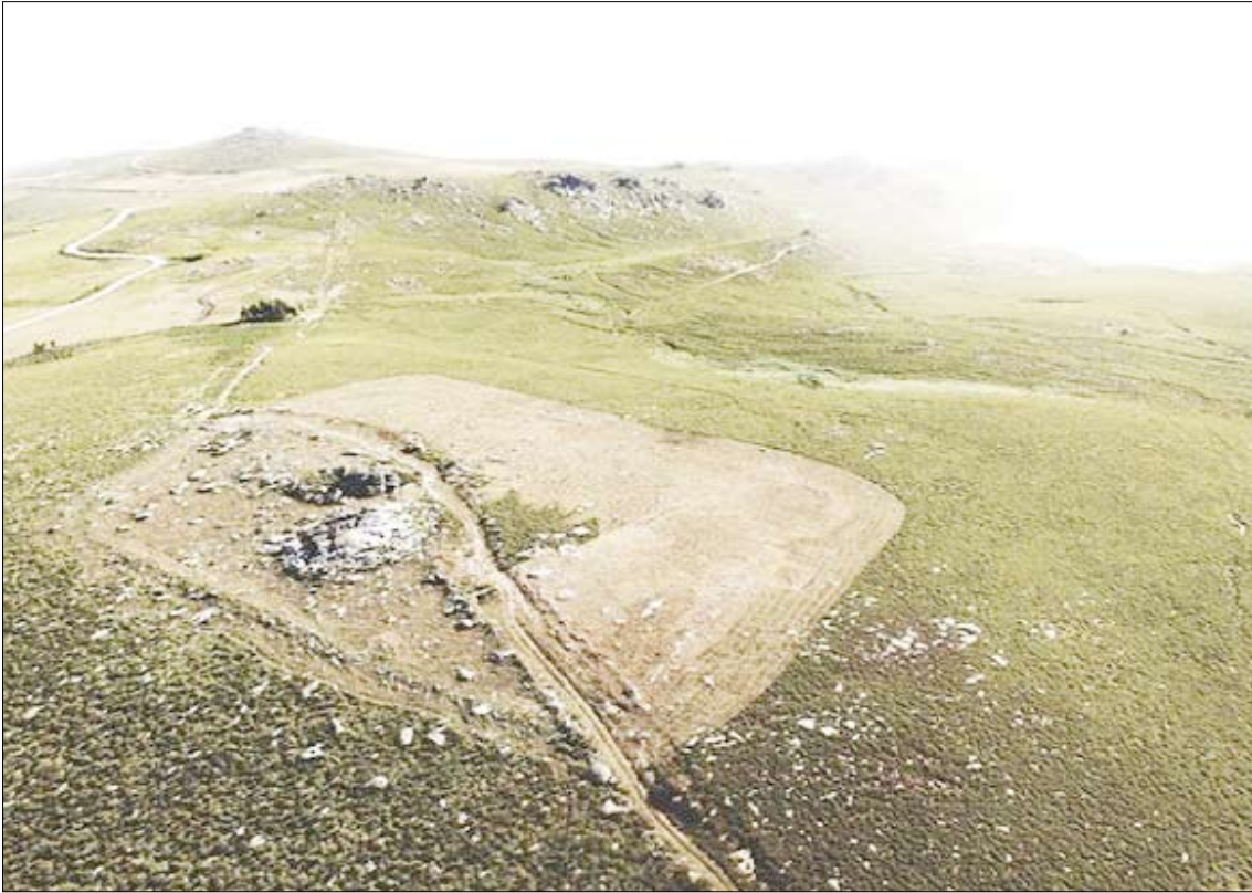
أحد المواقع المكتشفة

والتعرف على طرق الاستراتيجية العسكرية للقوات الرومانية وتحركاتها. ووفقاً للعلماء، سمح لهم هذا بالحصول على معلومات جديدة مثيرة عن الصراع الذي دام 200 سنة من أجل شبه الجزيرة الأيبيرية.