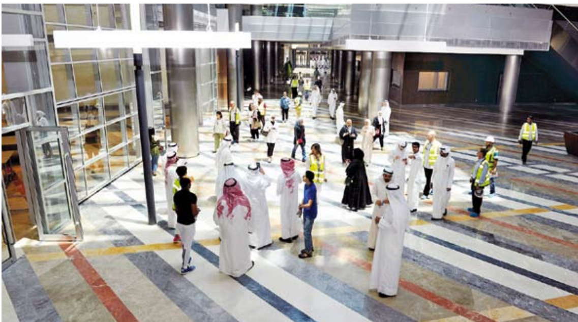
اللجنة العليا تتابع عن كثب اعمال المدينة الجامعية