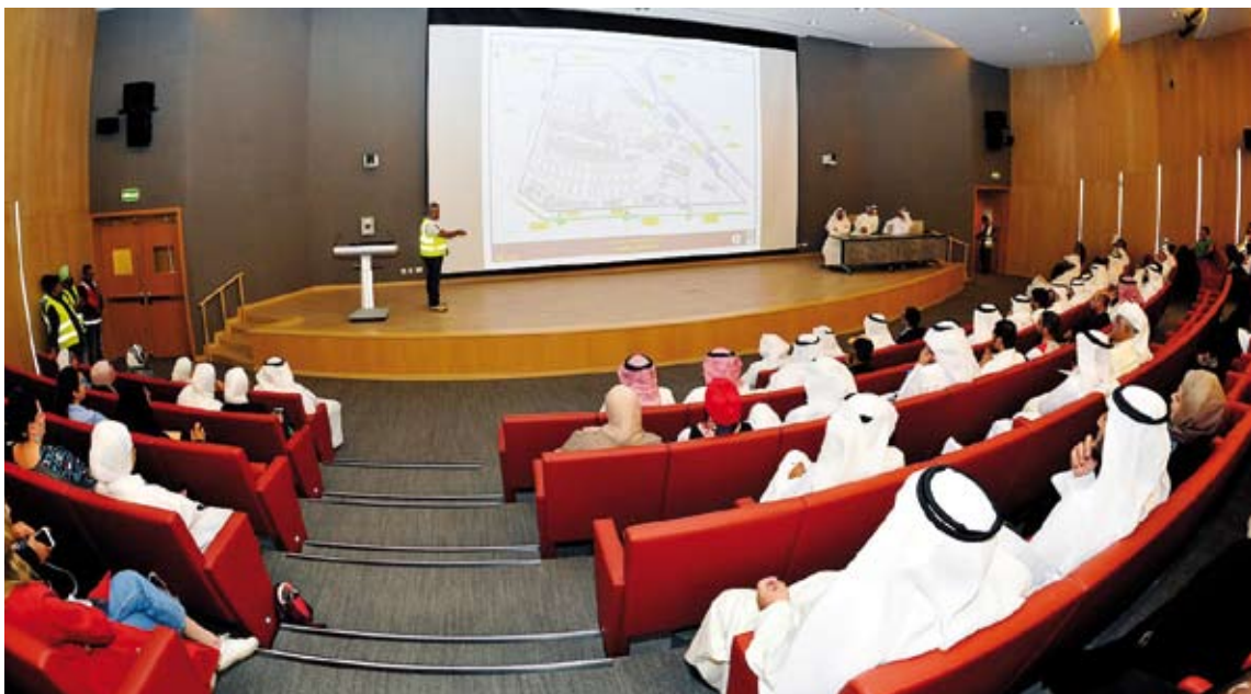
عرض تقديمي لمنشآت المدينة