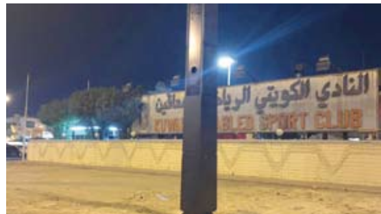
اللوحة الاعلانية امام مدخل النادي الرئيسي