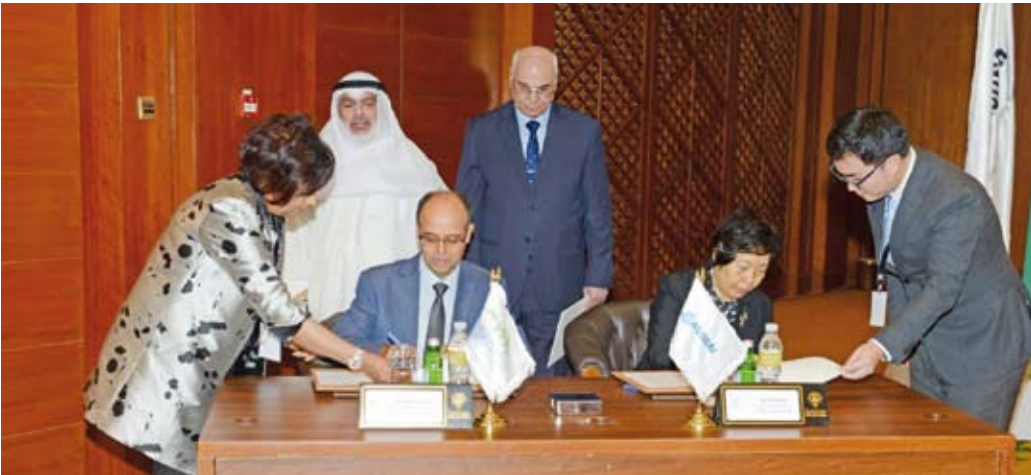
الجانبان خلال توقيع المذكرة