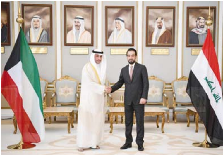
الغانم والحلبوسي خلال المباحثات

عقد رئيس مجلس الأمة مرزوق علي الغانم في مكتبه اليوم مباحثات رسمية مع رئيس مجلس النواب العراقي محمد الحلبوسي والوفد المرافق له وذلك بمناسبة زيارته الرسمية للبلاد. وجرى خلال المباحثات أمس بحث سبل توطيد علاقات التعاون المشترك بين الكويت والعراق في كافة المجالات لا سيما المتعلقة بالجانبين الاقتصادي والبرلماني. كما تم خلال المباحثات تبادل وجهات