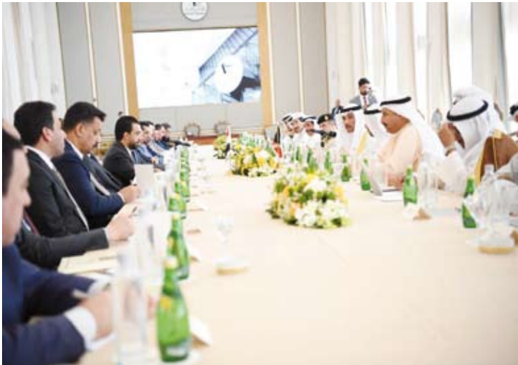
جانب من المباحثات بين الغانم واللغاثم والحلبوسي