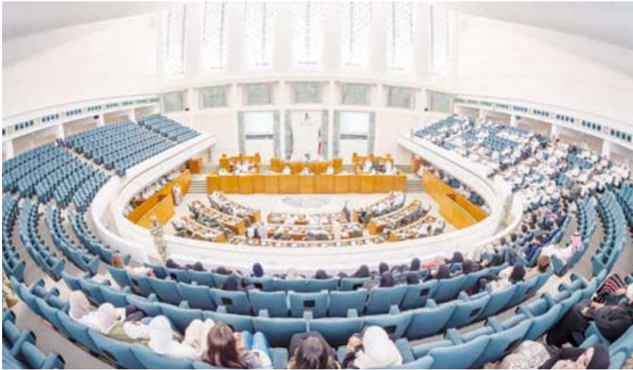
جانب من إحدى الجلسات

قدم النواب في دور الانعقاد العادي الثالث من الفصل التشريعي الخامس عشر 371 اقتراحاً برغبة، منها 363 بمعدل 98% من إجمالي الاقتراحات برغبة و8 رغبات مشتركة بمعدل 2%. وبلغ إجمالي الاقتراحات برغبة المقدم في الفصل التشريعي الخامس عشر 1877 اقتراحاً برغبة، منها 722 في دور الانعقاد الأول و528 في الدور الثاني. ووفق إحصائية أعدتها شبكة الدستور بالتعاون مع إدارة التوثيق والمعلومات في قطاع المعلومات بالأمانة العامة لمجلس الأمة، فقد تناولت تلك الرغبات قضايا المرافق والخدمات والصحية والتعليمية والرعاية الاجتماعية والاقتصادية والمتقاعدين وذوي الاحتياجات الخاصة والمرأة والزراعة والبيدوم من أبرز الرغبات التي قدمها النواب في دور الانعقاد الثالث جاءت كالتالي: • إنشاء أسواق مركزية لبيع المنتجات الزراعية والحيوانية والسكنية بالجملة والتجزئة في كل محافظة. • إنشاء مجلس لكتب الأطفال. • رفع سن القبول للمتقدمين لوظائف القطاع النقطي من حملة شهادة الدبلوم أو البكالوريوس من (28) إلى (35) عاماً. • إنشاء مركز صحي مختص بعلاج حالات العمق وتزويده بالكواادر الطبية المتخصصة وأحدث الأجهزة والمعدات الطبية.