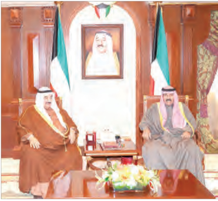
سمو ولي العهد يستقبل ناصر المحمد

استقبل سمو ولي العهد الشيخ نواف الأحمد بقصر بيان صباح أمس سمو الشيخ ناصر المحمد.