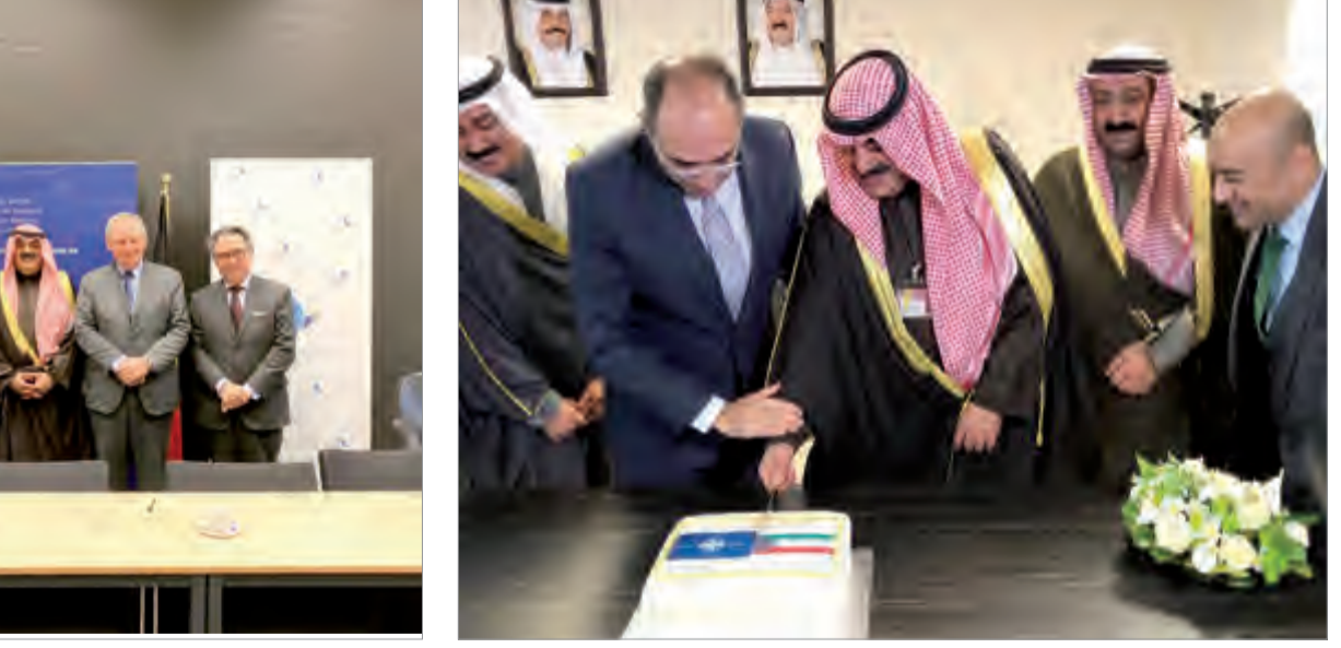
خالد الجارالله والبخاندرو الفارغونزاليز يشاركان في قطع كعكة اثناء حفل التدشين ببعثة

ولفت إلى أن علاقة الكويت بالحلف قد شقت طريقها منذ إطلاق مبادرة اسطنبول للتعاون في عام 2004 من جانب الناتو مضيفا بان دولة الكويت تعتبر أول دولة خليجية تنضم لهذه المبادرة. وأشاد بالزيارات المتبادلة ما بين مسؤولي حلف الناتو ودولة الكويت. وتابع «كلنا يذكري بالتقدير الدور الذي قام به حلف الناتو عندما تعرضت دولة الكويت إلى غزو الاحتلال العراقي وبدأت عملية تحرير دولة الكويت حيث كان لحلف الناتو ودوله الأعضاء دور مميز وجيوي ومحوري في عملية تحرير دولة الكويت». وأوضح الجار الله انه تباحث مع السفير البخاندرو الفارغونزاليز بشأن عدد من القضايا السياسية المتعلقة بدور الحلف وأنه لمس من السفير الفارغونزاليز اهتماما كبيرا وتقديرا بالغا