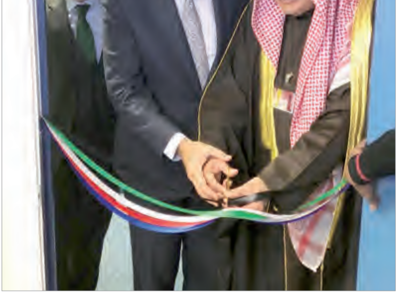
الجارالله والبخاندرو الفارغونزاليز اثناء حفل تدشين بعثة الكويت لدى منظمة (ناتو)

تناولت مسار العلاقات الثنائية بين البلدين وعدد من الموضوعات ذات الاهتمام المشترك. وقال الجار الله في تصريح لـ (كونا) وتلفزيون الكويت عقب اجتماعه مع بلجيين في بروكسل مساء امس الاثنين انهما بحثا الجوانب المختلفة للعلاقات الثنائية بين الكويت وبلجيكا وسبل تعزيزها على كافة الاصعدة. وأضاف انها تبادلا ايضا وجهات النظر حول التطورات في منطقة الشرق الاوسط واتفقا على ان الكويت وبلجيكا تشتركان بموقفهما حول قضايا المنطقة. ورافق الجار الله في الاجتماع مساعد وزير الخارجية الكويتي للشؤون الاوربية السفير وليد الخبيزي ومساعد وزير الخارجية لشؤون مكتب نائب الوزير السفير ايهم العمر وسفير الكويت لدى بلجيكا والاتحاد الاوروبي وحلف شمال الاطلسي (ناتو) ولوكسمبورغ جاسم البديوي.