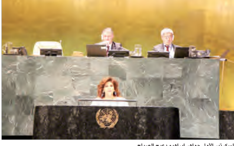
السكرتير الاول جواهر ابراهيم دعيج الصباح

مع الامم المتحدة فاقت الثلاثة عقود فانتنا ندعو الي تعميق التعاون القائم وتعزيزه بشكل اوفق من خلال ابرام المزيد من مذكرات التفاهم او الاتفاقات. وشددت الصباح على ضرورة الاخذ بعين الاعتبار امكانات تلك المنظمات ومسؤولياتها وذلك لرسم اطار واضح وفعال لآلية التعاون والتنسيق وتعزيز الحوار وتبادل الخبرات بينها. وأكدت أهمية توسيع اطار التعاون ليشمل المجالات التنموية والاقتصادية والاجتماعية والثقافية والانسانية والبيئية والامنية كون العمل على هذه الاصعدة يساعد على التصدي لجذور الأزمات والنزاعات ومعالجتها في الاساس. وذكرت «ان هذا التعاون يهدف الي تحقيق السلم والامن والاستقرار في منطقتنا العربية والاسلامية وصنع وبناء السلام فيها حق الشعوب والشقيقة في كل من فلسطين وسوريا واليمن وليبيا واقلية الروهينغيا المسلمة ان تنعم بالسلام والازدهار». وبيّنت الصباح أنه من حق هذه الشعوب ايضا تحقيق التنمية بعدما تعرضت لمعاناة انسانية كبيرة نتيجة الاوضاع الامنية المتدهورة والانتهاكات الجسيمة والصارخة للقانون الانساني الدولي والقانون الدولي لحقوق الانسان.