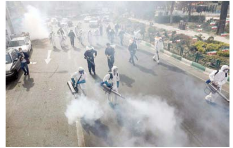
محاولات لتطهير شوارع طهران من الفيروس

قالت السلطات الصحية في إيران أمس إن معدل حصيلة فيروس كورونا المستجد يبلغ 50 إصابة في الساعة الواحدة فيما يتوفي شخص واحد كل عشر دقائق. ونقلت وكالة الأنباء الإيرانية الرسمية أرسا عن رئيس المركز الإعلامي بوزارة الصحة الإيرانية كيانوش جانيور القول "إنه في كل ساعة تقريباً يصاب 50 شخصاً بالفيروس كما يتوفي شخص مصاب بهذا الفيروس كل 10 دقائق كمعدل". وأضاف "إنه وفي ضوء هذه المعلومات يتوجب علينا اتخاذ القرار بوعي حول السفر والتنقل والزيارات لمناسبة عيد النوروز" الذي يمثل رأس السنة الجديدة بالتقويم الفارسي.