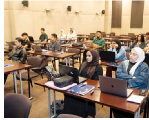
عدد من المشاركين