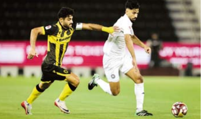
سقوط مفاجئ للسد أمام قطر

سقط السد حامل لقب الدوري القطري لكرة القدم، بشكل مفاجئ أمام قطر 3-2 في المرحلة الأولى التي شهدت تعثر وصيفه الدحيل بتعادل مخيب مع الشحانية 1-1. وكرر السد البداية المتعثر، بعدما كان قد سقط في استهلال النسخة الماضية التي احتفظ خلالها باللقب الثاني تواليًا، أمام الشمال 2-1. وتقدم قطر بهدف السبق عبر رأسية التونسي علي سعودي من ركنية (36). وعادل السد عن طريق البرازيلي الأصل المنضم حديثاً للمنتخب القطري غيليرمي تورييس بعدما تابع تسديدة كلاودينيو التي صدّها الحارس ووضعها في الشباك (62). وفي لحظة دخول البرازيلي روبرتو