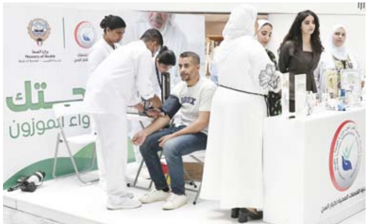
جانب من الحملة التوعوية

10 مساءً وتستمر اليوم الإثنين في مركز العيون الصحي من 9 صباحاً وحتى 12 ظهراً وغداً الثلاثاء في مركز الجارية الصحي (محمود حيدر) بالتوقيت ذاته. كما تتواصل يوم الأربعاء المقبل في مركز بيان الصحي ويختتم برنامج الحملة يوم الخميس المقبل في مستشفى جابر الأحمد من الساعة 9 صباحاً حتى 12 ظهراً. وتأتي هذه الحملة ضمن جهود وزارة الصحة لرفع مستوى الوعي المجتمعي بمخاطر تعدد الأدوية خصوصاً لدى كبار السن وتشجيعهم على مراجعة أدويتهم دورياً بالتعاون مع الأطباء والصيادلة المتخصصين.