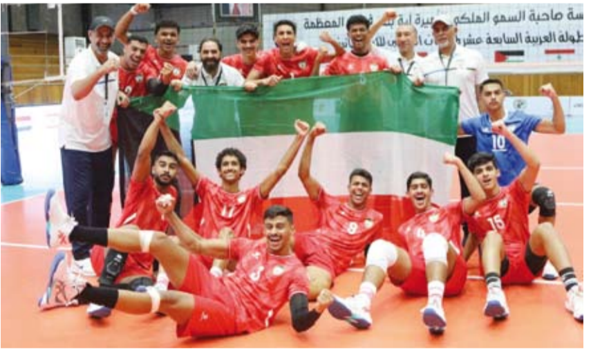
جانب من احتفال لاعبي الأزرق بالفوز

فاز منتخب الكويت لكرة الطائرة للناشئين على نظيره المنتخب الفلسطيني بثلاثة أشواط نظيفة في مستهل مشواره بالبطولة العربية لمنتخبات الناشئين لكرة الطائرة والمقامة حالياً في الأردن. وجاءت نتيجة الأشواط (25-20) و (25-14) و (25-20) على التوالي. من المقرر أن يقابل المنتخب الكويتي يوم غد الأحد نظيره البحريني ضمن منافسات المجموعة الثانية من البطولة. وانطلقت منافسات البطولة في وقت سابق اليوم في صالة قصر الرياضة بالمدينة الرياضية بالعاصمة الأردنية عمان وتستمر حتى 26 أغسطس الجاري.