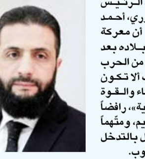
الرئيس السوري أحمد الشرع

أكد الرئيس السوري، أحمد الشرع، أن معركة توحيد بلاده بعد سنوات من الحرب "يجب ألا تكون بالدماء والعنف العسكري"، رافضاً أي تقسيم، ومتهماً إسرائيل بالتدخل في الجنوب. وقال، خلال جلسة حوارية مع عدد من وجهاء محافظة إدلب، في حضور وزراء وسياسيين بثها التلفزيون الرسمي ليل السبت - الأحد: "أسقطنا النظام في معركة تحرير سوريا، ولا تزال أمامنا معركة أخرى لتوحيد سوريا، ويجب ألا تكون بالدماء والقوة العسكرية، مؤكداً إيجاد آلية للتفاهم بعد سنوات منهكة من الحرب. وتأتي هذه الجلسة عقب مظاهرة تجمع فيها مئات وسط السويداء في جنوب سوريا، صباح السبت، تحت شعار "حق تقرير المصير" وتنديداً بأعمال العنف الدامية التي شهدتها المحافظة الشهر الماضي، التي أسفرت عن مقتل المئات، رُفعت فيها الأعلام الإسرائيلية. وأوضح الشرع: «لا أرى أن سوريا فيها مخاطر تقسيم (...) هذا الأمر مستحيل». وتابع: «بعض الأطراف تحاول أن تستقوي بقوة إقليمية، إسرائيل أو غيرها، هذا أمر صعب للغاية ولا يمكن تطبيقه»، في إشارة إلى مطالب بعض الدروز في السويداء بالتدخل الإسرائيلي.