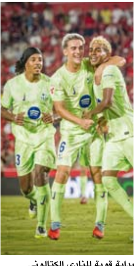
ديابية قوية للنادي الكتالوني

حقق برشلونة فوزاً سهلاً 3-صفر على مايوركا في مستهل رحلة دفاعه عن لقب دوري الدرجة الأولى الإسباني لكرة القدم في أول ظهور لمهاجمه الإنجليزي ماركوس راشفورد من على مقاعد البدلاء. وسجل رافينيا هدف التقدم بعد سبع دقائق من بداية المباراة ثم ضاعف فيران توريس النتيجة في الدقيقة 23 ليضع بطل إسبانيا في المقدمة. 1989. في عام 1989.