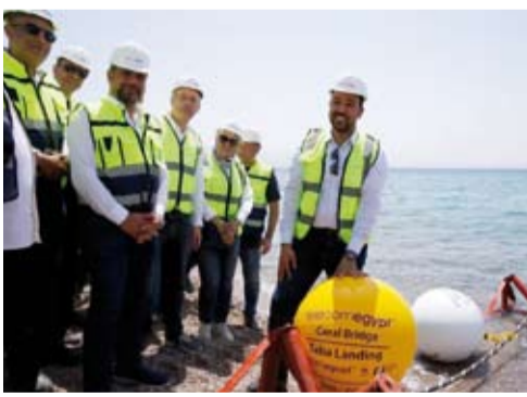
جانب من إنزال الكابل البحري

شهدت مدينة (طابا) المصرية إنزال الكابل البحري "كورال بريدج" الذي يعد أول كابل بحري مباشر يربط بين مصر والأردن منذ أكثر من 25 عاماً وذلك في إطار استراتيجية توسيع ودعم البنية التحتية الرقمية الدولية لمصر. وقالت وزارة الاتصالات المصرية في بيان صحفي إن الكابل الجديد يمتد عبر خليج العقبة بطول 15 كيلو متراً ويمثل ربطاً رقمياً عالمياً لسرعة مدعماً بعدد كبير من شعيرات الألياف الضوئية موضحة أنه يوفر ربطاً سلساً بين آسيا وأفريقيا وأوروبا ويعزز من سرعة نقل البيانات الدولية ويخفض تكاليفها خاصة مع تزايد الطلب على تطبيقات الذكاء الاصطناعي ومراكز البيانات.