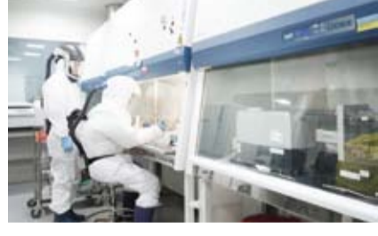
جانب من التجارب

أعلن باحثون من معهد كوريا لبحوث العلوم البيولوجية والتقنية الحيوية عن تطوير علاج مبتكر لسرطان الرئة يعتمد على أجسام نانوية فائقة الصغر، قادرة على استهداف الخلايا السرطانية بدقة عالية مع تقليل الآثار الجانبية المصاحبة للعلاجات التقليدية. ووفق النتائج المنشورة في دورية «انتقال الإشارات والمعالجة الموجهة»، أظهر العلاج الجديد، المسمى الجسم النانوي A5، نسب نجاح تراوحت بين 70% و90% في التجارب على الحيوانات ونماذج مأخوذة من مرضى سرطان الرئة.