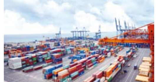
أكثر من تريليون دولار قيمة الصادرات الخليجية من السلع

قال المركز الإحصائي لدول مجلس التعاون لدول الخليج العربية ان قيمة الدخل القومي الإجمالي (إجمالي الدخل الذي يحققه المواطنون والشركات) لدول المجلس بالأسعار الجارية في عام 2023 بلغت تريليون و 143.1 مليار دولار أمريكي بانخفاض 2.7 بالمائة مقارنة بتريليون و 202.7 مليار دولار بنهاية عام 2022.