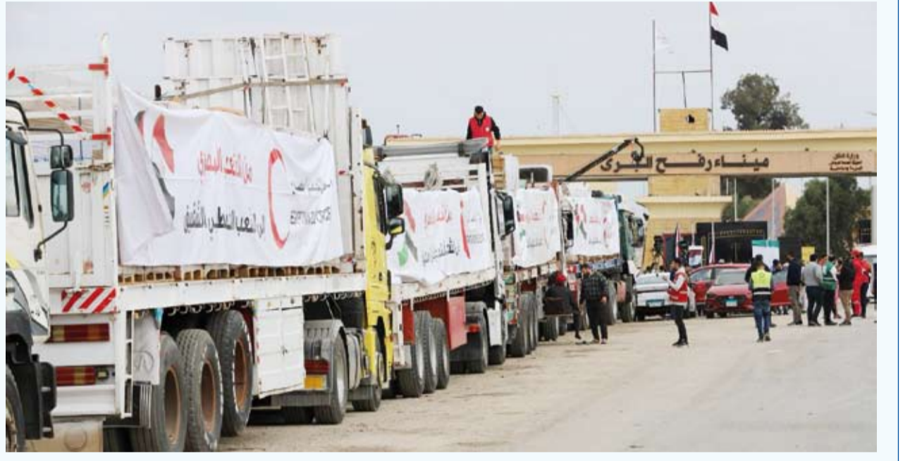
قافلة زاد العزة تدخل إلى قطاع غزة محملة بنحو 2400 طناً من المساعدات

غزة) إلى جنوب قطاع غزة عبر معبر (كرم أبو سالم) محملة بنحو 2400 طن من المساعدات الغذائية والطبية والإغاثية العاجلة التي يحتاجها القطاع.