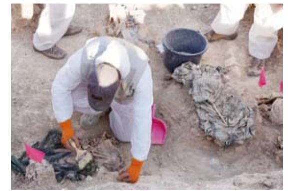
البحث عن رفات ضحايا تنظيم داعش في مقبرة جماعية بمحافظة نينوى

توثيق الجرائم واستحصال حقوق الضحايا ونويعهم ضمن إطار قانوني وإنساني وبإشراف الجهات القضائية والأمنية والطبية والفنية المختصة». وأضاف الدخيل أن «مقبرة الخسفة جريمة يندى لها العقل والضمير وهي جرح نينوى الغائر» مشيراً إلى أن عدد الضحايا بلغ نحو 20 ألفاً وأنه تم في يوم واحد فقط اعدام أكثر من ألفي مواطن من أهالي مدينة الموصل بينهم 600 ضحية من منطقة وادي حجر.