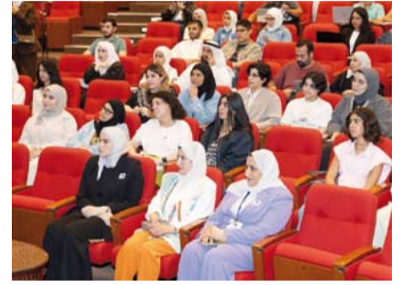
جانب من حفل الانطلاق

في مسيرة كل مشارك باعترابه فرصة لصلح المواهب والاستفادة من خبرات المدربين، مشيراً إلى أن مجال الألعاب الإلكترونية واسع ومتشعب ويمكن أن يشكل مصدراً للمتعنة والاحتراف معاً فضلاً عن تحقيق عوائد مالية كبيرة. وأضاف أن هذه الصناعة باتت منبراً للشباب الكويتي لإبراز طاقاتهم على الساحة الدولية ورفع اسم الكويت في المحافل العالمية، مستشهداً بنماذج عدة من الشباب الكويتي الذين تمكنوا من تحقيق إنجازات لافتة في هذا المجال.