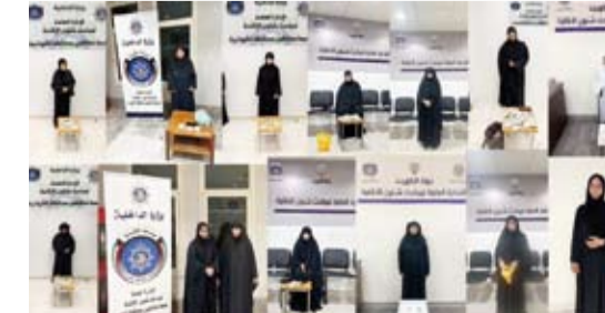
ضبط 14 متسولة

المحاسبة يستعمل كلاً من العامل وصاحب العمل، مشددة على أن التسول بمختلف أشكاله يمثل إساءة للمجتمع وقانون الإقامة والعمل، وأن