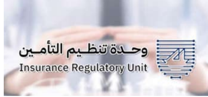
إجراءات من شأنها تسهيل حالة الوثائق عبر الوسائل التكنولوجية

التزوير التي شهدها قطاع التأمين سابقاً إلى جانب تعزيز الوعي بالحقوق والالتزامات المترتبة على المتعاملين في السوق. وذكر أن القرار يسهم في وضع حد لاي تفاوت في تسعير الوثائق بين الشركات إذ أصبحت آلية احتساب الأقساط موحدة بالكامل في القرار وملاحقه بما يرسخ مبدأ الشفافية بين شركات التأمين والملاء. وأشار إلى أن نظام رمز الاستجابة السريعة سيطبق بعد مرور 180 يوماً من تاريخ نشر القرار في الجريدة الرسمية مانحا الشركات فترة كافية لتتوافق أوضعها وتجهيز أنظمتها بما يتوافق مع المتطلبات الجديدة مبيناً أن جميع الشركات ملزمة من تاريخ النشر باتباع