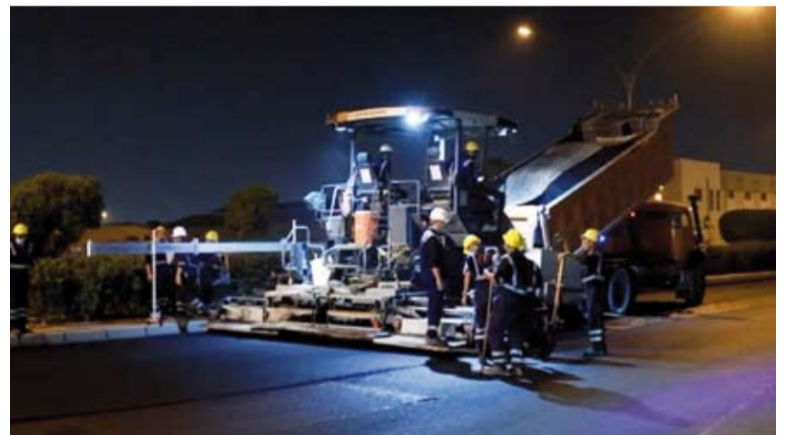
جانب من فرش الاسفلت بمنطقة صباحان شارع 101