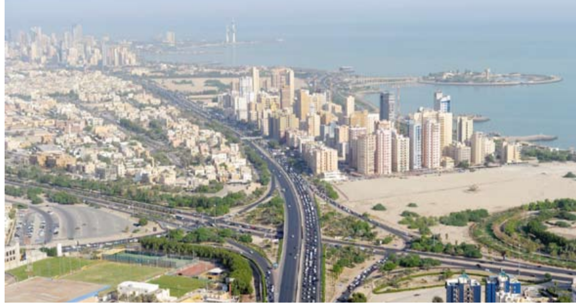
مساعي حكومية نحو تنويع المعروض السكني والتقليل م تضخم الاسعار

متواصلة لتلبية طلبات المواطنين في الحصول على سكن ملائم خصوصاً وأن عدد الطلبات الإسكانية القائمة بلغ 101.6 ألف طلب في نهاية ابريل الماضي بزيادة سنوية بلغت 4.6 في المئة. وأرجع التقرير الزيادة السنوية الى حرص المواطنين على الاستفادة من قانون التمويل العقاري المرتقب مبيناً ان المؤسسة تمكنت من إنشاء عدد كبير من القسائم السكنية التي صدر لها انن بناء منها قسائم وزعت بالفعل على مستحقيها وأخرى جاهزة للتسليم كما في مدينة المطاع التي سلمت فيها 27.6 ألف قسيمة إضافة إلى 28.3 ألف تعد جاهزة للتسليم. وأوضح ان المؤسسة سلمت أكثر من 3.2 ألف قسيمة في جنوب عبدالله المبارك ونحو 3.3 ألف قسيمة جاهزة للتسليم في المنطقة إضافة إلى حوالي 1.4 ألف قسيمة سلمت في خيطان بجانب أكثر من 1.4 ألف قسيمة جاهزة للتسليم بالمنطقة علاوة على تخطيط المؤسسة لتنفيذ 124 مبنى عام مخطط بناؤها في 7 مدن سكنية. وأشار التقرير الى جهود المؤسسة في توزيع المشاريع السكنية في عدة مدن منها مشروع مدينة جنوب سعد العبدالله