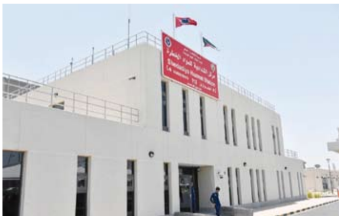
مركز الشدادية للمواد الخطرة