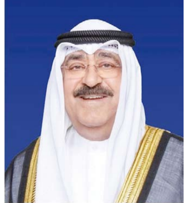
سمو أمير البلاد الشيخ مشعل الأحمد

متنياً سموه رعاه الله لفخامته موفور الصحة والعافية ولجمهورية الغابون وشعبها الصديق كل التقدم والازدهار.