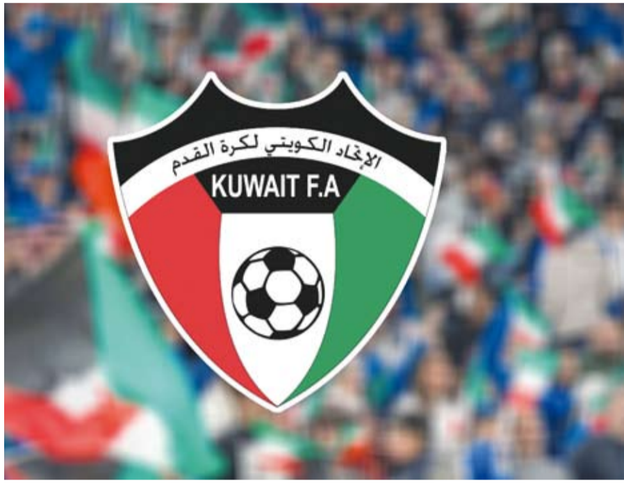
مراجعة شاملة لقانون الرياضة في الكويت

على اللجنة الأولمبية تشكيل لجنة محايدة تتولى إدارة العمليات الانتخابية