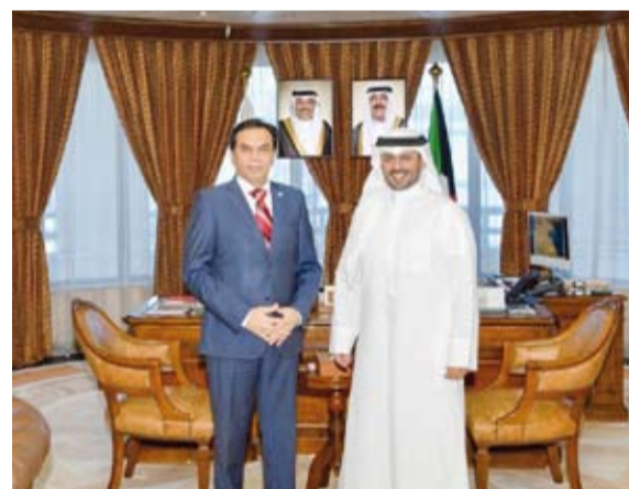
محافظ مبارك الكبير يستقبل سفير باكستان

استقبل محافظ مبارك الكبير ومحافظ حولي بالتكليف صباح بدر صباح السالم الصباح، في ديوان عام المحافظة صباح أمس سفير جمهورية باكستان الإسلامية لدى دولة الكويت ظفر أقبال.