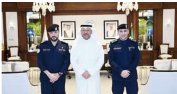
المحافظ مستقبلاً مدير الأمن ومساعدته