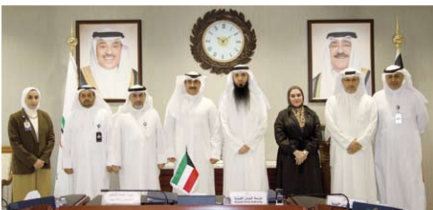
لقطة جماعية للمشاركين