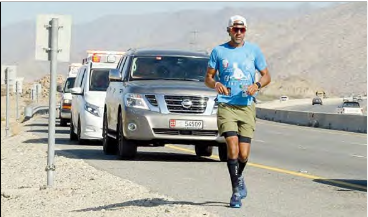
الرحالة الإماراتي الدكتور خالد السويدي

وصل الرحالة الإماراتي والمدير التنفيذي لمركز الإمارات للدراسات والبحوث الاستراتيجية الدكتور خالد السويدي إلى مكة المكرمة مساء أول أمس بعد رحلة دامت شهراً كاملاً بدأت مطلع الشهر المنصرم مشياً على الأقدام. وجاءت انطلاقا الرحالة خالد السويدي من جامع الشيخ زايد بالعاصمة الإماراتية أبو ظبي، على أن يقطع مسافة 2070 كيلو مترا، بين جري و مشي، حاملاً شعار الحب والسلام، ومؤكداً متانة الروابط الأخوية بين الشعبين السعودي والإماراتي. وأوضح الدكتور السويدي في تصريح لوكالة الأنباء السعودية أن هذه الرحلة جاءت للتعبير عن تقديره للعلاقات الأخوية التي تربط دولة الإمارات والمملكة العربية السعودية، معرباً عن شكره وتقديره لجميع الجهات الحكومية في المملكة، على التسهيلات والتعاون والخدمات التي قدمت له، مؤكداً إسهامها بعد توفيق الله العليّ القدير، في وصوله إلى بيت الله العتيق. وأوضح أن الهدف من رحلته، إيصال رسالة محبة إلى المملكة العربية السعودية قيادة وشعباً، مبدياً عن سعاداته الغامرة بهذا الترحيب والمحبة والتقدير غير المستغرب من أبناء المملكة، الذين نذروا أنفسهم لخدمة بيت الله الحرام وقاصديه، مشيراً إلى التشجيع والتحفيز الصادق الذي قوبل به من إخوته في المملكة، إذ كانت هذه المشاعر ذات أثر بالغ على همته وعزمته ومحفة له لإنهاء هذه الرحلة.