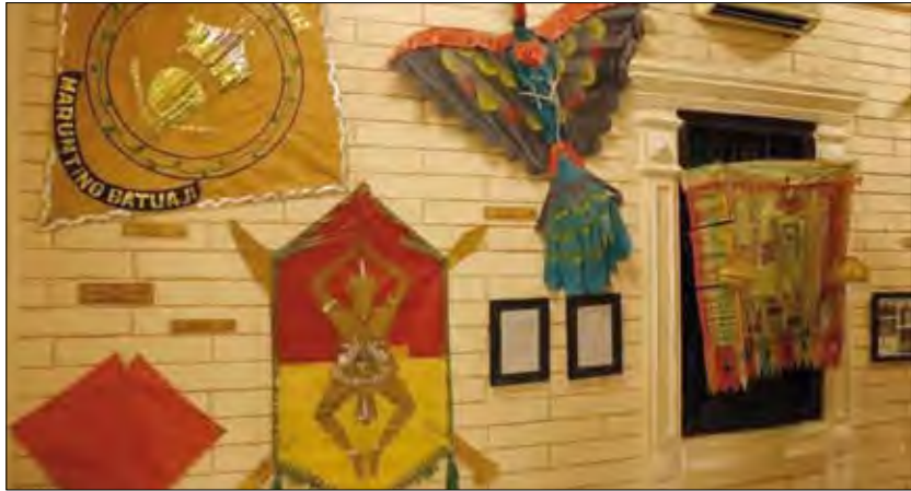
متحف الطائرات الورقية

تحتضن العاصمة الإندونيسية جاكارتا، متحفا للطائرات الورقية، يهدف الحفاظ عليها وتوريثها إلى الأجيال القادمة، لكونها تحمل قيمة ثقافية كبيرة. وافتح المتحف أبوابه عام 2003، ويعتبر الأول والوحيد في البلاد، ويمتد على مساحة قدرها حوالي ألفين و 500 متر. ويحتوي المتحف على مجموعة واسعة من الطائرات الورقية القديمة، فضلا عن صالة عرض