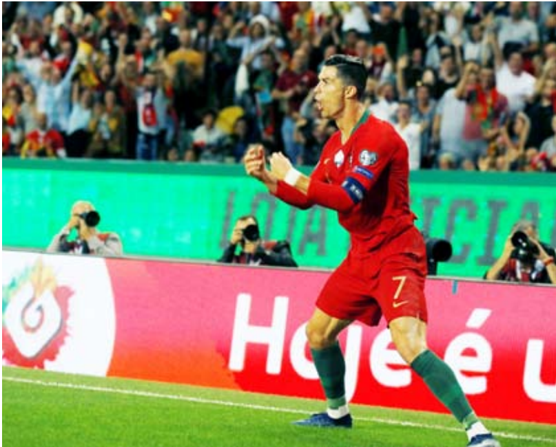
رونالدو سجل هدف البرتغال الثاني