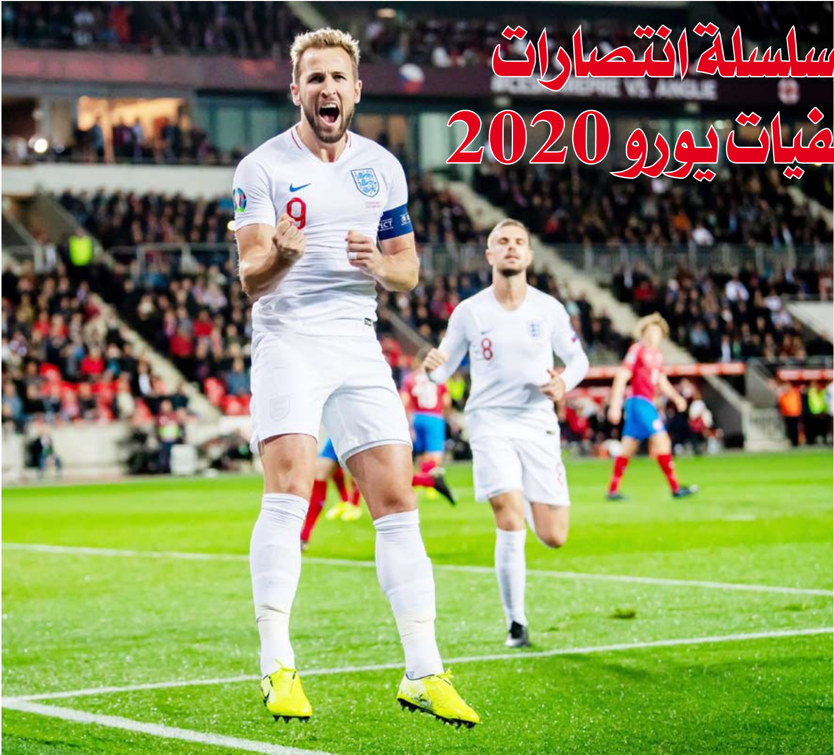
هاري كين سجل هدف إنجلترا الأول من ركلة جزاء