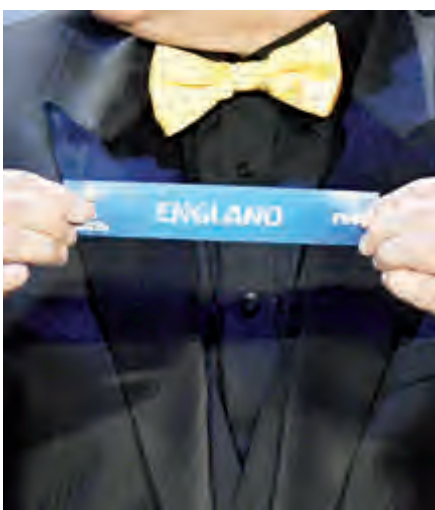
ارتياح في إنجلترا بعد القرعة

ويستهل المنتخب الإنكليزي مشاوره في المونديال بمواجهة نظيره التونسي في الجولة الأولى من مباريات المجموعة السابعة، علماً بأن الفريقين التقيا في المجموعة السابعة أيضاً بالدور الأول من مونديال 1998 بفرنسا، وقد شارك ساونغيث في تلك المباراة، التي انتهت بفوز إنجلترا 2-0. وبدأ آلان شيرار، القائد السابق للمنتخب الإنكليزي، أكثر حذراً في تحليله لما أسفرت عنه القرعة. وقال شيرار في تصريحات لهيئة الإذاعة البريطانية (بي.بي.سي): «لا أريد قول إنها مجموعة جيدة أو مجموعة سيئة، لأنني سمعت ذلك في العديد من المرات في الماضي».