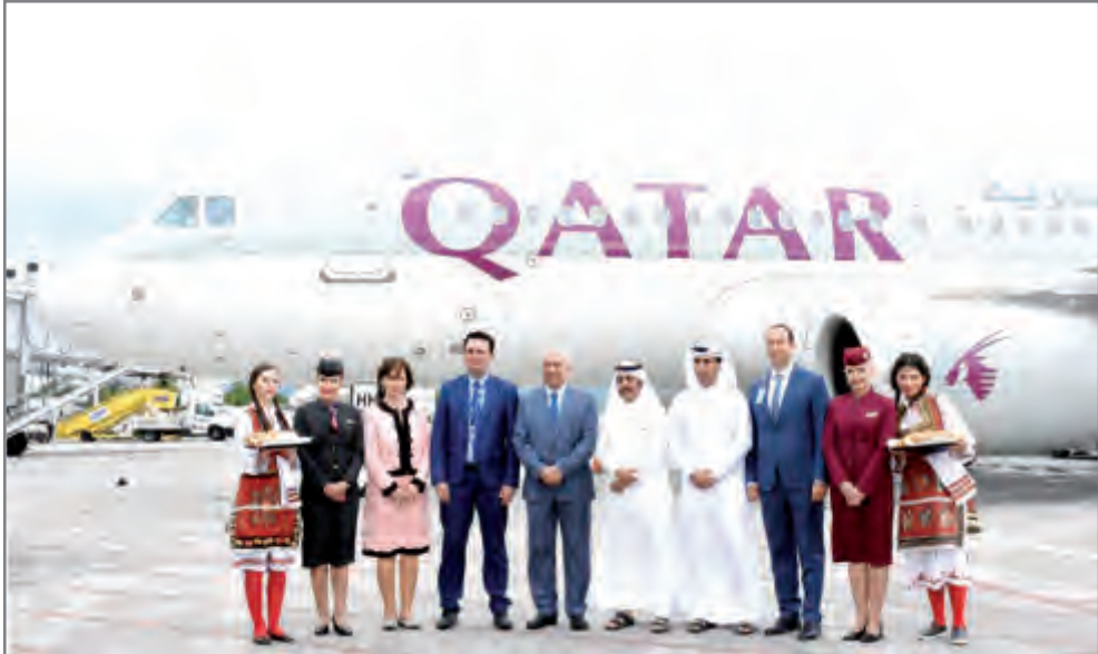
القطرية تدشن رحلات مباشرة إلى سكوبيه

وبالإضافة إلى ما سبق، توفر الرحلات الجديدة إلى سكوبيه مساحة من الشحن من شأنها تعزيز نمو التجارة جواً في جمهورية مقدونيا، وذلك من خلال ربط البلاد مع كبار المستوردين في شمال شرق آسيا عبر مقر عمليات الناقلّة القطرية في الدوحة. وأعلنت القطرية للشحن الجوي مؤخراً عن إطلاق مركز التحكم بدرجة الحرارة الذي يعزز حلول نقل السلع ضمن درجة حرارة محددة ويوفّر خدمة نقل على أفضل وجه للغواكة والمنتجات الطازجة من سكوبيه.