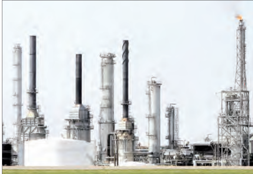
النفط يميل إلى الارتفاع

الماضي. وترى الوكالة الدولية للطاقة ان المنتجين الاميركيين السبعة الكبار للغاز الصخري سينتجون 558 ألفاً و500 برميل يوميا في أغسطس، اي بزيادة قدرها 113 ألف برميل عن يوليو. وأشارت حين فو المحللة لدى مجموعة "سي ام سي ماركتس" في سنغافورة الى "أسفلق المستمر من ارتفاع الانتاج في الولايات المتحدة" الذي يجعل ارتفاع الاسعار ضئيلا. وينتظر المستثمرون نشر الارقام الرسمية للاحاطات الاميركية الارباض. ويفترض ان تكشف هذه الارقام وضع الطلب على الخام في اكبر اقتصاد في العالم.