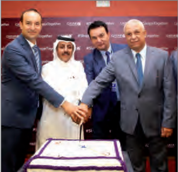
الخطوط القطرية تواصل إنجازاتها

◆ الرحلات الجديدة إلى سكوبيه تتزامن مع خطط التوسع المتسارعة للناقلّة ◆ الرحلة الافتتاحية للخطوط القطرية تصل إلى مطار الإسكندر الأكبر