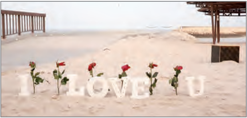
جميرا يحتفي بيوم الحب

تقدم الوجهة الفندقية الأكثر فخامة في الكويت عرض إقامة مميز للأزواج في جناح ديلوكس لليلة مع عشاء رومانسي لشخصين في مطعم أوليو الإيطالي الحائز على عدة جوائز. هذا بالإضافة الى وجبة إفطار شهية تقدم داخل الغرفة في صباح اليوم التالي. كما يتيح المنتجع الفاخر فرصة إستثنائية لمفاجأة الشريك مساء يوم الحب بعشاء لا ينسى على شرفة الطعام الإيطالي ذات الإطلالة الخلابة على الشاطئ مع النسمات المنعشة وباقة من أشهى الأطايب. ويمكن للأزواج الإستمتاع بقائمة طعام مكونة من خمسة أطباق مختلفة في مطعم أوليو تقدم لهم داخل Gazebo، الشرفة الرومنسية المطلّة على البحر للخطات فريدة وإطلالة مميزة. وسيقدم مطعم بيبس ستيك هاوس الوجهة المثالية للأزواج الباحثين عن الأجواء الرومانسية النابضة بالحب، إذ يتيح لهم تناول وجبة مؤلفة من خمسة أطباق خاصة بالمناسبة، والإستمتاع بمذاق شرائخ اللحم ضمن أجوائه النابضة بالحياة مع عروض الترفيه الحية. هذا وسيقدم مطعم سولت قائمة مكوّنة من خمسة أطباق أيضاً من أشهى المأكولات البحرية