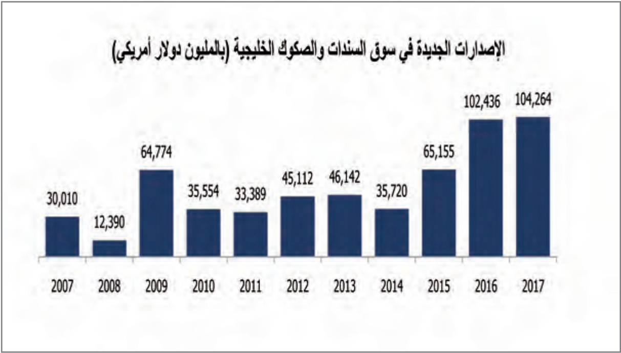
الإصدارات الجديدة في سوق السندات والصكوك الخليجية

أصدر المركز المالي الكويتي “المركز” تقريره الأخير بعنوان: ” أسواق الصكوك والسندات الخليجية” الذي يسلط الضوء على إصدارات الصكوك والسندات المصدرة في منطقة دول مجلس التعاون الخليجي خلال العام 2017. وأشار التقرير أنإجمالي قيمة إصدارات الصكوك والسندات الأولية في أسواق دول مجلس التعاون الخليجي، بما فيها إصدارات البنوك المركزية والإصدارات السيادية لحكومات دول الخليج وإصدارات الشركات، قد بلغ 174.17 مليار دولار في عام 2017، بارتفاع قدره 3.96% مقارنة بإجمالي قيمة الإصدارات التي تمت في عام 2016. وكانت إصدارات الصكوك والسنداتلمملكة العربية السعودية في الصدارة من حيث الحجم الإجمالي للإصدارات.