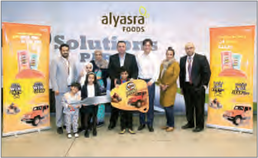
اليسرة و برينجلز تعلنان الفائز في حملة برينجلز