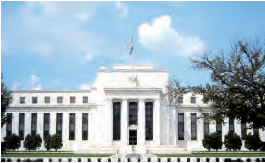
وزارة الخزانة الاميركية

مدتها عامين في الشهر الماضي بقيمة 26 مليار دولار، حيث بلغ سعر العائد عليها 395ر3، و1% ومعدل التغطية 3ر06 مرة من قيمة الطرح. يذكر أن معدل التغطية هو مقياس للطلب على السندات، حيث يشير إلى حجم الاكتتاب مقارنة بحجم الطرح.