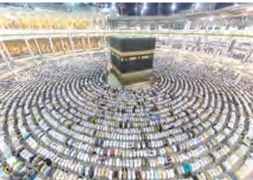
ارتفاع عوائد الحج

تري أهمية تشجيع الاستثمار الأجنبي، على اعتبار أنه يساعد في الحدائق الرأسمالية المباشرة، وإدخال وتطبيق طرق إدارة جديدة وتشغيل العمالة المؤقتة، مشيرة إلى ضرورة دراسة معوقات الاستثمار الأجنبي في الحج، والعمل على تسهيل دخول الشركات ذات القدرة والسمعة الجيدة لخدمة ضيوف الرحمن.