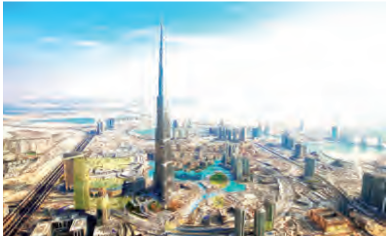
الإمارات اول دولة خليجية تقوم بتطبيقها