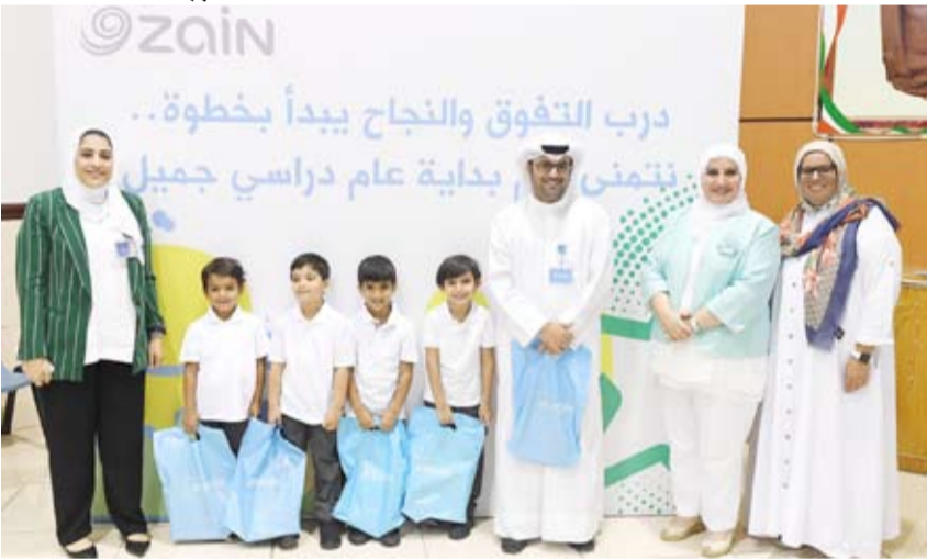
فريق زين مع الطلبة وإدارة المدرسة

والإعلام الأمني بوزارة الداخلية وتستهدف جميع المراحل الدراسية، وتضم العديد من الأنشطة والبرامج التوعوية التي تستند على مدار العام الدراسي الجديد. وبيّنت الشركة أن دعمها لبرنامج الحملة سيبتمز على مدار العام الدراسي الجديد 2019-2020، وهي تستهدف جميع المراحل الدراسية، ابتداءً من مرحلة رياض الأطفال، والمرحلة الابتدائية، والمرحلة المتوسطة، والمرحلة الثانوية، وحتى المرحلة الجامعية، وترتكز على خمسة عناصر أساسية: الثقافة المرورية، والتوعية بأقة المخدرات والمؤثرات العقلية، وحماية الأحداث وتوجيههم إلى الطريق الصحيح، والتعريف بالجرائم الإلكترونية وحدود الاستخدام الآمن لوسائل التواصل الاجتماعي، وتعزيز القيم في المجتمع للتعاون والحفاظ على المكتبات العامة والخاصة وتعزيز الولاء للوطن.