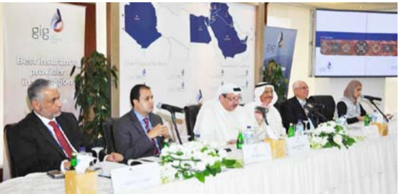
اجتماع سابق لـ«الخليج للتأمين»

أعلنت بورصة الكويت عن قيام شركة مشاريع الكويت القابضة (كيبكو) بشراء 1.232 مليون سهم من أسهم رأسمال شركة مجموعة الخليج للتأمين. وقالت البورصة في بيان على موقعها الرسمي أمس الأحد، إن عملية الشراء تمت خلال تعاملات يوم الخميس الماضي 5 سبتمبر 2019. وأوضحت أن الشراء تم عن طريق أحد أعضاء مجلس الإدارة في «الخليج للتأمين» كاحد ممثلي «كيبكو» في المجلس. وأفادت بأن الشراء تم لقاء سعر متوسط للسهم الواحد بلغت 653 فلساً؛ ما يعني أن قيمة الشراء الكلية تُقدّر بنحو 804.7 ألف دينار. الجدير بالذكر أن «كيبكو» تمتلك الحصة الأكبر في رأسمال «الخليج للتأمين» بنسبة