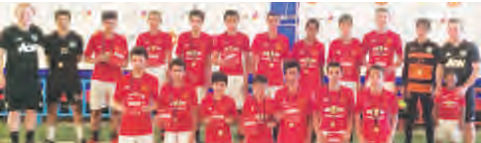
صورة جماعية في ختام الاختبارات

باختبار 32 لاعباً من ضمن أكثر من 700 مشارك، تم اختيارهم على مدى يومين لتأهيل أفضل 16 لاعباً سيعلن عنهم قريباً ليفوزوا بفرصة الالتحاق بالبرنامج التدريبي في أكاديمية مانشستر يونايتد خلال موسم الصيف في إنكلترا.