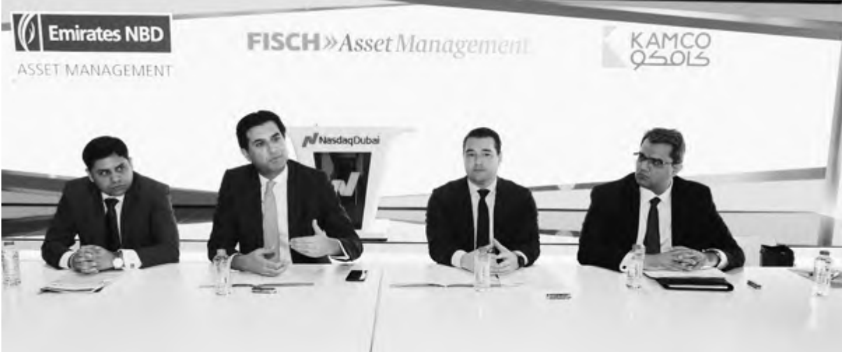
محللو الشركات المشاركين في إصدار التقرير