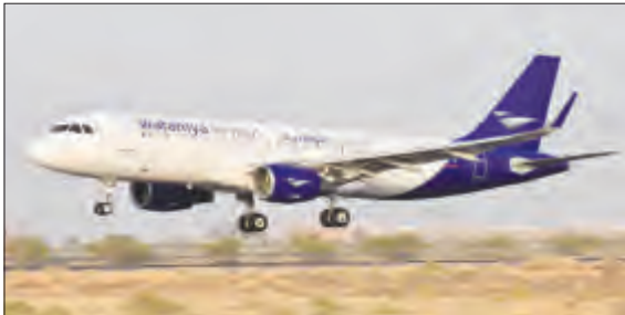
أحدى طائرات الخطوط الوطنية

الى ان الخطوط الوطنية تسعى لتقديم أفضل الخدمات بأقل تكلفة ممكنة وتقديمها بأسعار مناسبة لجميع شرائح المسافرين، وأنها ستقدم أسعاراً وعروضاً مميزة للمسافرين من وإلى بيروت بعد إطلاق الرحلات في نوفمبر المقبل. وتتخذ الخطوط الوطنية من مطار الكويت الدولي مركزاً