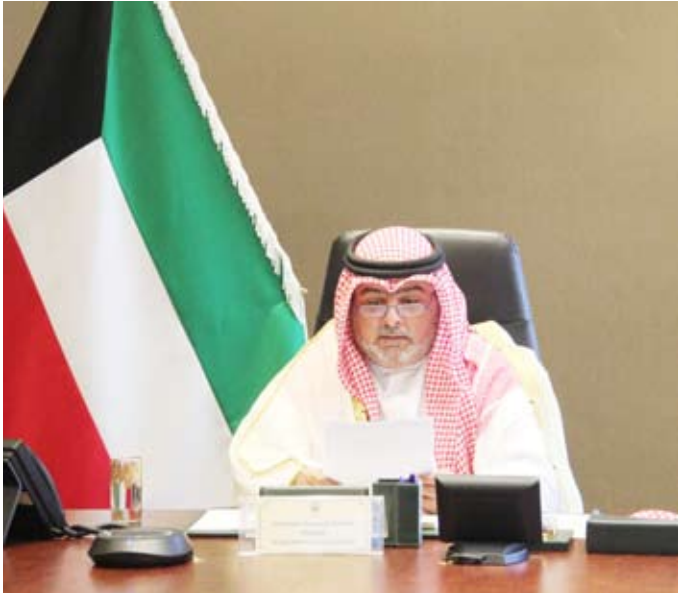
الشيخ ثامر العلي خلال مشاركته

وناقش المنتدى في جلساته الحوارية الرؤى الألمانية والخليجية حيال الأمن في المنطقة، إضافة إلى التعاون في المجالات الدبلوماسية والاقتصادية وإدارة الأزمات.