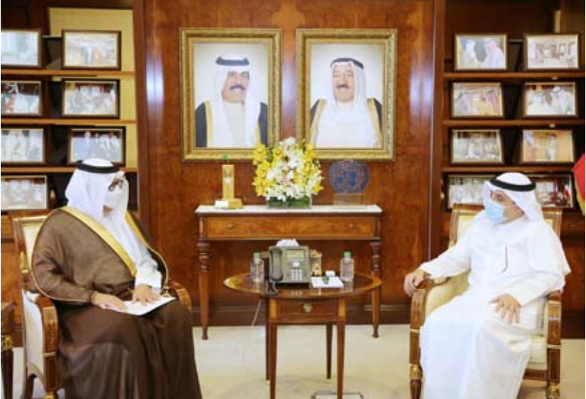
الشيخ الدكتور أحمد ناصر المحمد خلال استقباله سمو الأمير سلطان بن سعد بن خالد

الخارجية لشؤون مجلس التعاون لدول الخليج العربية السفير ناصر المزين، ومساعد وزير الخارجية لشؤون مكتب وزير الخارجية السفير صالح اللوغاني وعدد من كبار مسؤولي وزارة الخارجية.