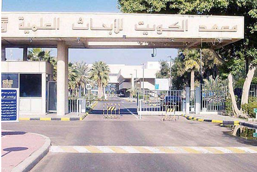
معهد الكويت للأبحاث العلمية

المنطقة قد تتعرض لكثير من الأخطار كترسيات وتراكمت الرمال بفعل الرياح ما يستوجب حمايتها وفق نظام لا يخل بالتوازن البيئي والحياة الفطرية.