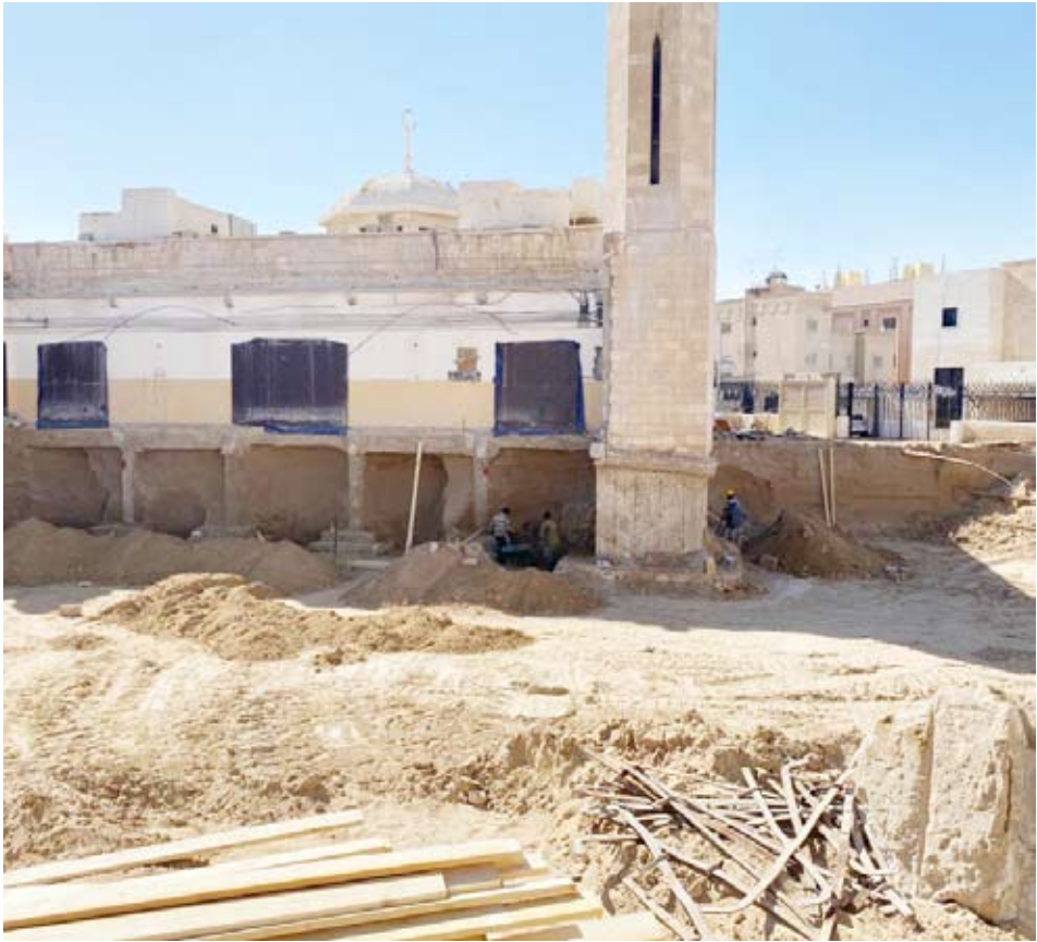
موقع مسجد «الأندلس»

سوق العمل الخاص، إلا أن لائحة المزاولة الحالية تحد من فرص انخراطهم للعمل بالقطاع الخاص من خلال فتح مكاتب هندسية صغيرة وعدم الانتظار بطوابير ديوان الخدمة المدنية للتعيين بالقطاع الحكومي ليكونوا بطلالة مقبلة لسنوات طويلة، حيث أن أغلبهم يتم تعيينه بتخصصات غير تخصصاتهم.