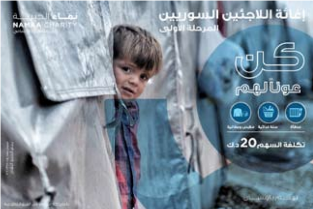
حملة لإغاثة اللاجئين السوريين