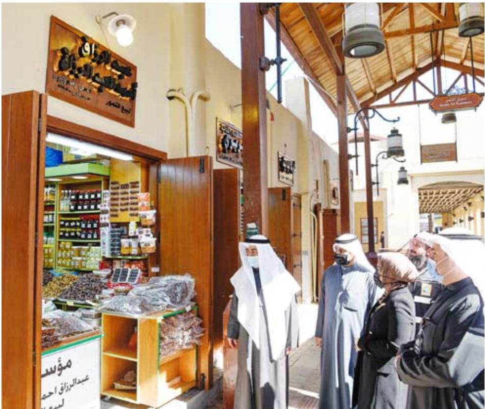
جانب من الجولة في أسواق المباركية التراثية

الدويش: إن سوق التمور بمنطقة المباركية يعد أحد المعالم التاريخية في دول الكويت والتي لها رمزية في المجتمع ليس فقط في الكويت وإنما لكل الأثرين للبلاد.