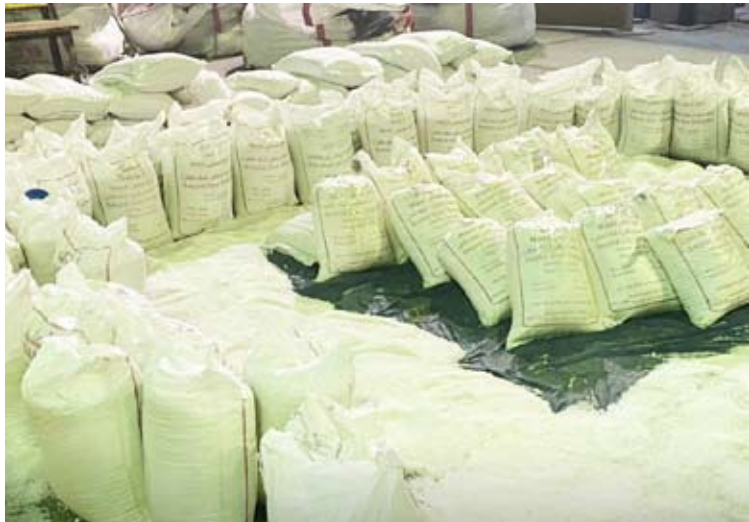
ضبط كميات كبيرة من مادة «الشبو»