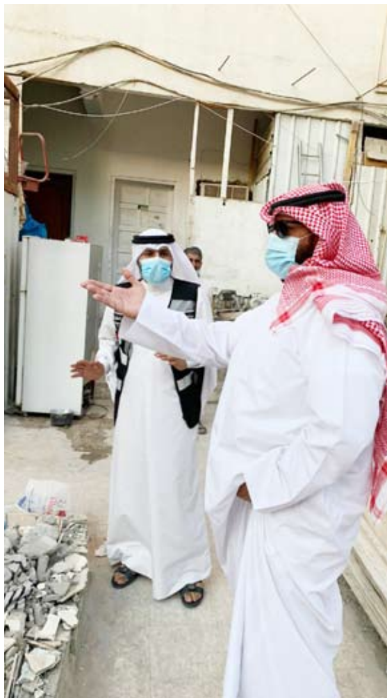
الشيخ طلال الخالد خلال جولته

أكد محافظ العاصمة الشيخ طلال الخالد، أن "المحافظة تسعى بالتنسيق مع الجهات المعنية لاستصدار قانون أو إجراء بعض التعديلات على بعض مواد القوانين المعمول بها بما يلزم بإزالة العقارات القديمة والمتهاكة في مناطق المحافظة وذلك لتشويهها المظهر العام". جاء ذلك في تصريح صحفي للمحافظ الخالد، على هامش جولته الميدانية، التي أجراها أول أمس، على منطقة بنيد القار. وأوضح الخالد أن "هذه العقارات قائمة منذ حقبة زمنية ماضية"، مؤكداً أن "المحافظة مستمرة بالتعاون مع الجهات المعنية في إزالة مخالفات البناء لكافة العقارات ولن تتوقف إلا بعد الانتهاء منها تماماً". وبين أن "عدد العقارات الاستثمارية المخالفة والتي تم إندازها في منطقتي شرق وبنيد القار منذ بداية حملة المحافظة ذات الصلة، تبلغ 51 عقارا منها 31 عقارا في المنطقتين شرع ملاكها في إزالة مخالفات بنائها حتى الآن"، مهنياً "جميع المواطنين وملاك العقارات، التعاون الكامل مع فريق الطوارئ لفرع بلدية المحافظة وغيره من الجهات المعنية تجنباً للمسائلة القانونية وإقرارا للمصلحة العامة". وضمن الخالد، جهود الجهات المتعاونة مع المحافظة ومن بينها وزارة الدولة لشؤون البلدية ممثلة في فريق الطوارئ، وإدارة النظافة العامة وإشغالات الطرق - مراقبة النظافة لفرع بلدية المحافظة.