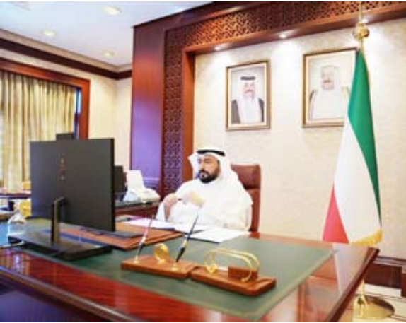
الشيخ الدكتور باسل الصباح خلال مشاركته في الاجتماع

وتعزيز قدرات مزاوولي مهنة الطب والمهن الصحية وتشجيع ممارسة الرياضة وأنماط الحياة