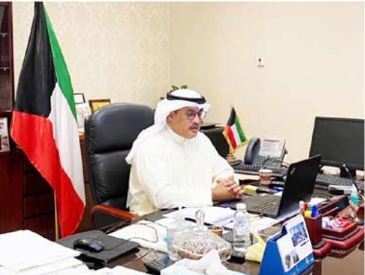
المستشار جمال الجلاوي خلال مشاركته في الاجتماع

أعلنت الإدارة العامة للجمارك الكويتية أمس، مشاركة مديرها العام المستشار جمال الجلاوي في الاجتماع الإقليمي الـ 52 لمديري الجمارك بشمال إفريقيا والشرق الأدنى والأوسط الذي عقد (عن بعد). وقالت (الجمارك) في بيان صحفي: إن الاجتماع استعرض الإجراءات التي ستقوم بها الدول ضمن التحضير المسبق لاجتماع مجلس المنطقة الـ 37 الذي سيعقد في خلال الفترة بين 9 و11 ديسمبر المقبل لإجراء انتخابات منصب رئيس منظمة الجمارك العالمية لافتة إلى تطوير آلية الانتخابات لضمان نزاهة التصويت التي تم تنظيمها بشكل إلكتروني. وأشارت في هذا الشأن إلى الاتفاق على إعداد آلية لمشروع التتبع الإلكتروني