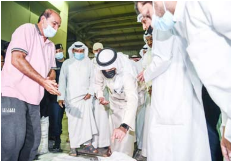
الصالح يطالع على المادة التي تم ضبطها