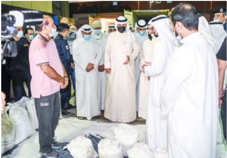
وزير الداخلية أنس الصالح يشرف على العملية