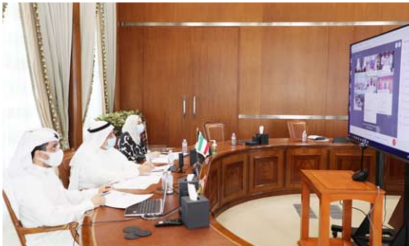
وفد ديوان المحاسبة

بالإضافة إلى الاطار العام لتنفيذ الندوات والمؤتمرات واطار عمل ومعايير محددة للتعريف بقرارات العمل المشترك التعريف بالقرارات المشتركة. وأشار إلى أنه تم مناقشة موضوع إصدار قرار إعلان اعتماد أبو ظبي بشأن "تعزيز التعاون بين الأجهزة العليا للرقابة المالية والمحاسبة وهيئات مكافحة الفساد على منع الفساد ومكافحته بمزيد من الفعالية ورفعته إلى أصحاب المعالي رؤساء الدواوين لاعتماده، وإعداد مشروع جدول أعمال الاجتماع السابع عشر لأصحاب المعالي رؤساء الدواوين، بالإضافة إلى مناقشة البند الخاص بموضوع الرقابة الشاملة المشتركة، وبند اعتماد موضوعات المسابقة الخامسة لمجلس التعاون للبحوث والدراسات في مجال الرقابة والمحاسبة.