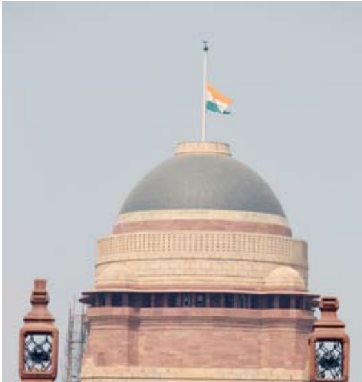
تنكيس الأعلام في مقر الرئيس الهندي تقديراً لدور سمو الأمير الراحل