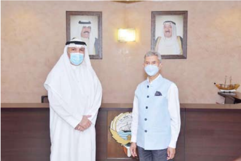
السفير جاسم الناجم مع وزير الشؤون الخارجية الهندي سوبراه منيام جاي شانكا

في جميع أنحاء البلاد لمدة يوم في الرابع من أكتوبر الجاري احتراماً للأمير دولة الكويت الراحل المغفور له سمو الشيخ صباح الأحمد. وتم تنكيس الأعلام في المباني الحكومية من المقر الرئاسي والبرلمان الهندي ووزارة الشؤون الخارجية والسلاح الجوي والبحري وغيرها في جميع أنحاء الهند.