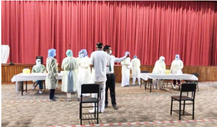
إجراءات فحص «كورونا» بالتعاون مع إدارة الصحة العامة

التابعة للهيئة في هذا المجمع الأسبوع الجاري. وأعربت عن الشكر الجزيل لوزارة الصحة ممثلة بإدارة الصحة العامة التي لم تتوان أبدا في تقديم الدعم اللوجستي والمعنوي في كل ما من شأنه حماية النزلاء. كما قدمت الشكر لجميع الإدارات المعنية في المجمع التابعة للهيئة العامة العامة لشؤون ذوي الإعاقة وعلى رأسها المركز الطبي التأهيلي لكل الجهود المبذولة.