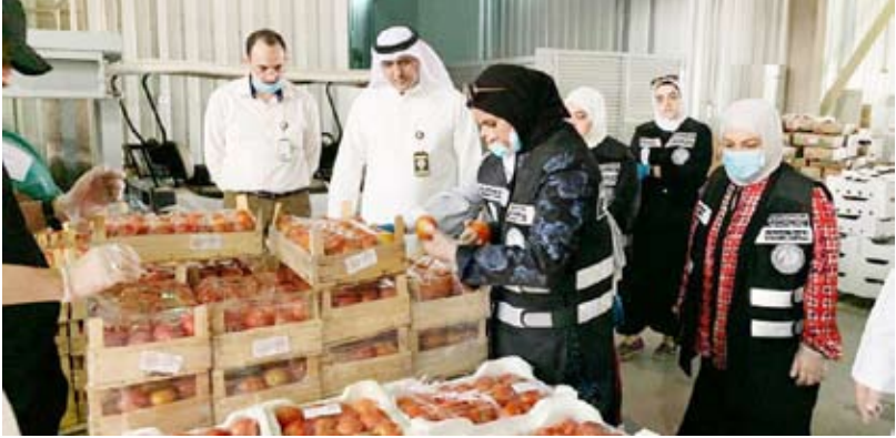
جانب من الجولة التفقدية