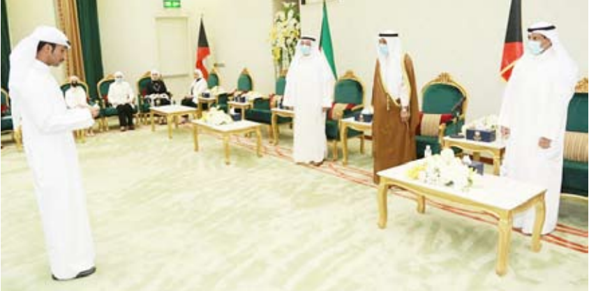
جانب من تادية اليمين القانونية أمام رئيس المجلس الأعلى للقضاء

من القاضيات ذكر أن تجربة عمل القاضيات يقتضي تقييمها بعد مضي مدة حتى يمكن التوسع فيها مشدداً على دور القاضيات الجدد في إنجاح هذه التجربة. وأكد على ضرورة الالتزام بكافة التوجيهات التي تؤدي الى حسن أداء القضاء لعملهم واستعداد المحكمة لتذليل أي صعوبات تواجههم.