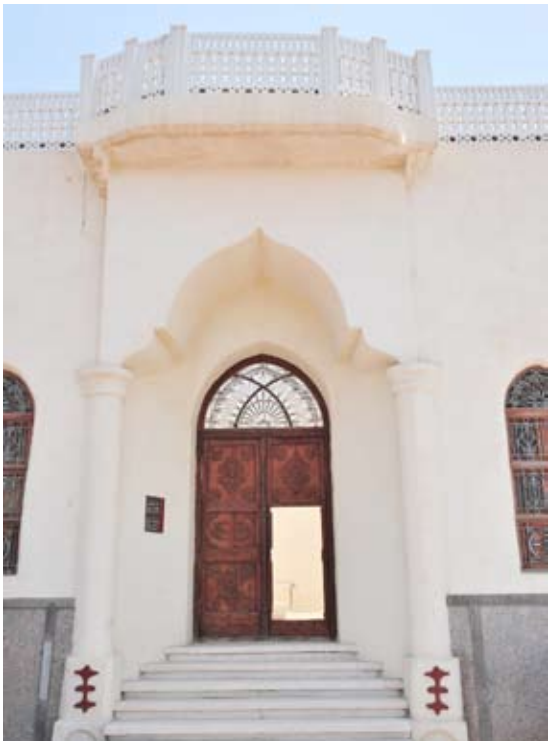
مبنى جمعية السدو