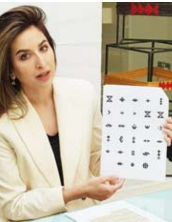
الشيخة بيبي الدعيج الصباح

تشجيع الشباب للعمل اليدوي الحرفي والابتكار في مجال تقاليد الحياكة والنسيج والمخابرة في إبراز التراث الثقافي الكويتي والتعريف به محلياً وإقليمياً وعالمياً. وأوضحت أن الجمعية تأسست في عام 1991 للحفاظ على تراث المنسوجات الغني والمتنوع وتوثيقه والتعريف به والسعي للاحتراف بقيمة الماضي الجميل من تفان في العطاء وهمة وإبداع في العمل تأسجا بذلك رابطاً وهوية ثقافية لأجيال الحاضر والمستقبل.