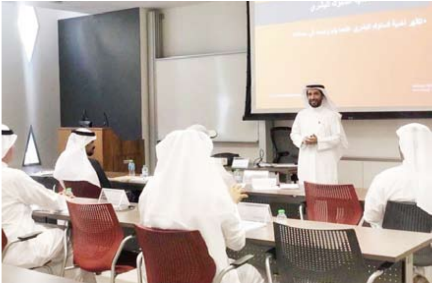
جانب من إحدى الدورات التدريبية