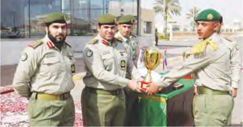
دروع التفوق لأحد الخريجين

احتفل معهد تدريب قوات الحرس الوطني بتخريج دورة المستجدين الأغرار التي تضمنت علوماً أمنية وإدارية وتدريباً عملية على الرماية وفنون القتال، وتمازين لرفع اللياقة البدنية. والقى مدير معهد تدريب قوات الحرس الوطني العقيد صالح غنيم مطيران كلمة نقل خلالها إلى الخريجين تهاني القيادة العليا للحرس الوطني ممثلة في رئيس الحرس الوطني سمو الشيخ سالم العلي ونائب رئيس الحرس الوطني الشيخ مشعل الأحمد ووكيل الحرس الوطني الفريق الركن مهندس هاشم الرفاعي، مشيداً بأدائهم المشرف خلال مراحل التدريب واستيعابهم لجميع النواحي النظرية والعملية بما يؤهلهم للانضمام للعمل العسكري وأداء واجبه تجاه وطنهم بكل كفاءة واقتدار.