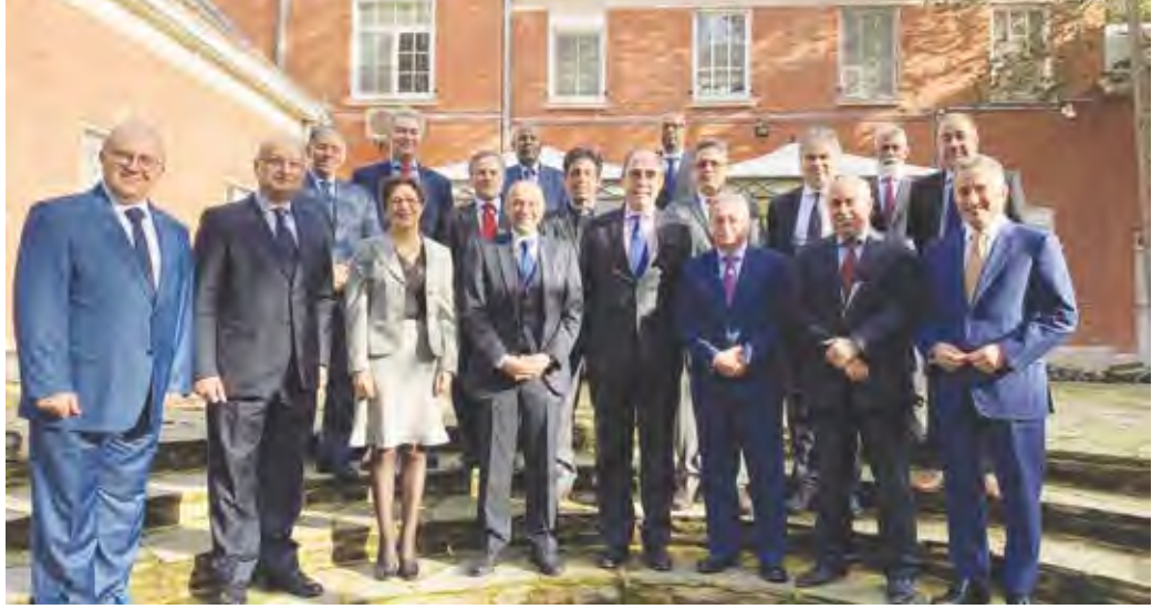
صورة للسفير الكويتي مع السفراء العرب في بروكسل

إسطنبول للتعاون. واطلقت المبادرة التي تشمل حالياً الكويت والبحرين وقطر والإمارات العربية المتحدة في اجتماع قمة قادة الناتو في إسطنبول عام 2004 بهدف تعزيز التعاون الأمني العملي مع دول الخليج العربية. وتقدم الأمين العام لحلف الأطلسي ينس شتولتنبرغ أعضاء مجلس شمال الأطلسي الذي ضم ممثلين عن الناتو خلال مراسم الاحتفال بافتتاح المركز الإقليمي في الكويت في يناير 2017. وشدد شتولتنبرغ خلال مراسم الافتتاح على قدرة المركز على تعزيز الشراكة بين الناتو ودول الخليج العربية بما في ذلك بمجال مكافحة الإرهاب.