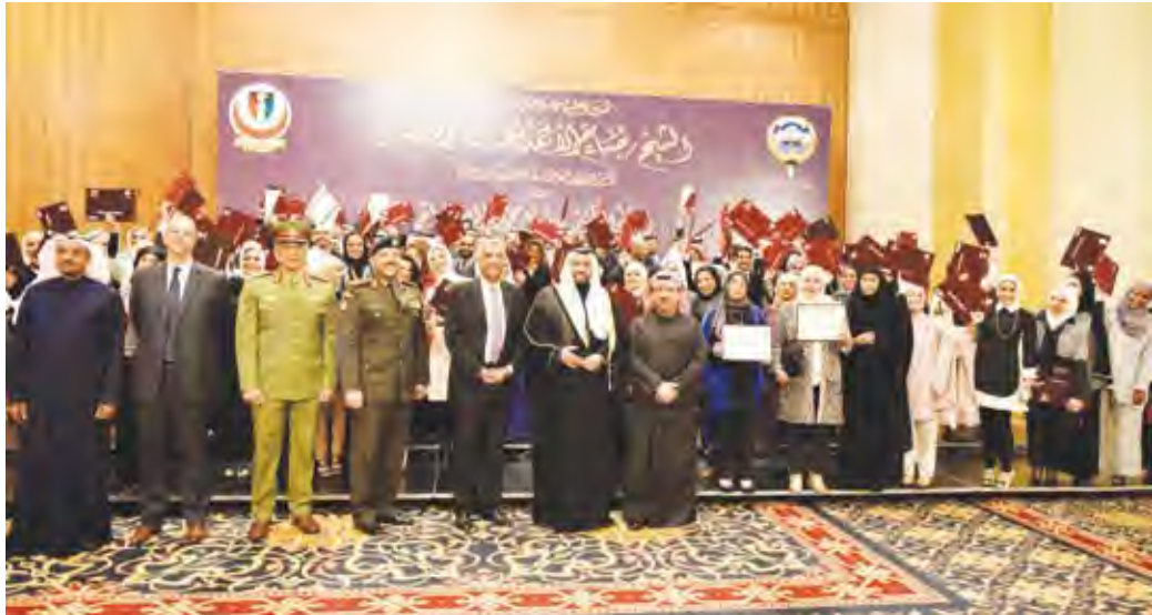
وزير الصحة مع الأطباء الخريجين

♦ هادي: معهد الكويت للاختصاصات الطبية يستهدف حالياً زيادة عدد المقاعد الدراسية