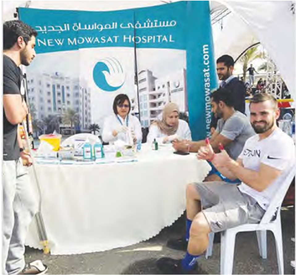
جانب من تقديم الفحوصات الطبية