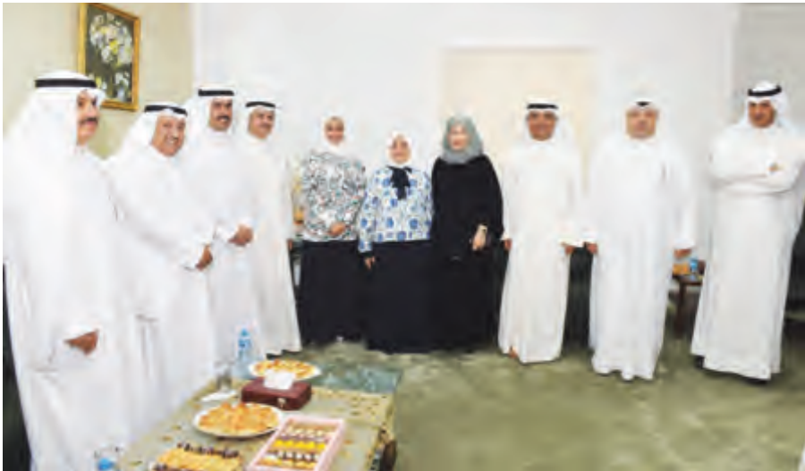
الوزيرة هند الصباح مستقبله مهنيينها

كشفت وزيرة الشؤون الاجتماعية ووزيرة الدولة للشؤون الاقتصادية هند الصباح أن القوى العاملة قامت بحملات خلال إجازة العيد على العديد من المناطق أسفرت عن ضبط عدد كبير من المخالفين وتم اتخاذ الإجراءات القانونية معهم، وأضافت خلال استقبالها للمهنيين بعيد الأضحى لكن هناك حملات ستكون بمشاركة جهات حكومية متعددة وليست فقط من القوى العاملة والداخلية سنتم بإشراك البطاقة المدنية ووزارة التجارة لكافة وسيتم التدقيق بكل الرخص المسجل عليها عمالة وهي لا تعمل وسوف يتم إلغاء هذه الرخص وهي ستكون إحدى الخطوات القوية في وجه تجار الإقامات وهذه التراخيص تفتح لاستقدام العمالة وثم ويقفلون الرخص وتصبح العمالة سائبة، وسيتم تطبيق قانون تغليظ العقوبات عليهم التي اعتمد مؤخرا والحمد لله أن أغلبية القضايا التي حكمت بأحكام عالية بالخرامة، وإذا استمر العمل بهذه الوثيرة سنقل من انتشار العمالة السائبة. وهناك أيضا النخاطم الألي