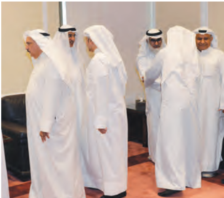
جانب من المهنيين