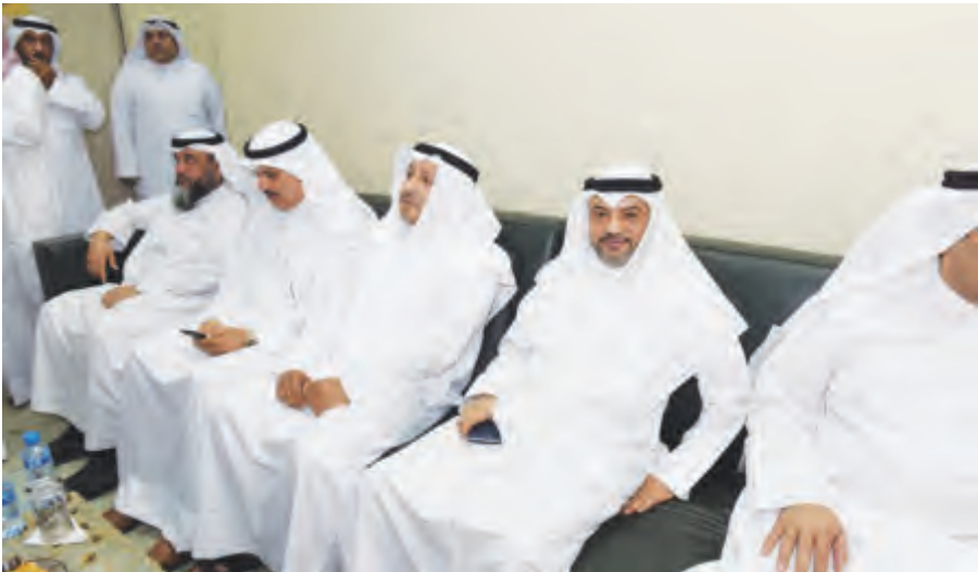
قيادات وزارة الشؤون