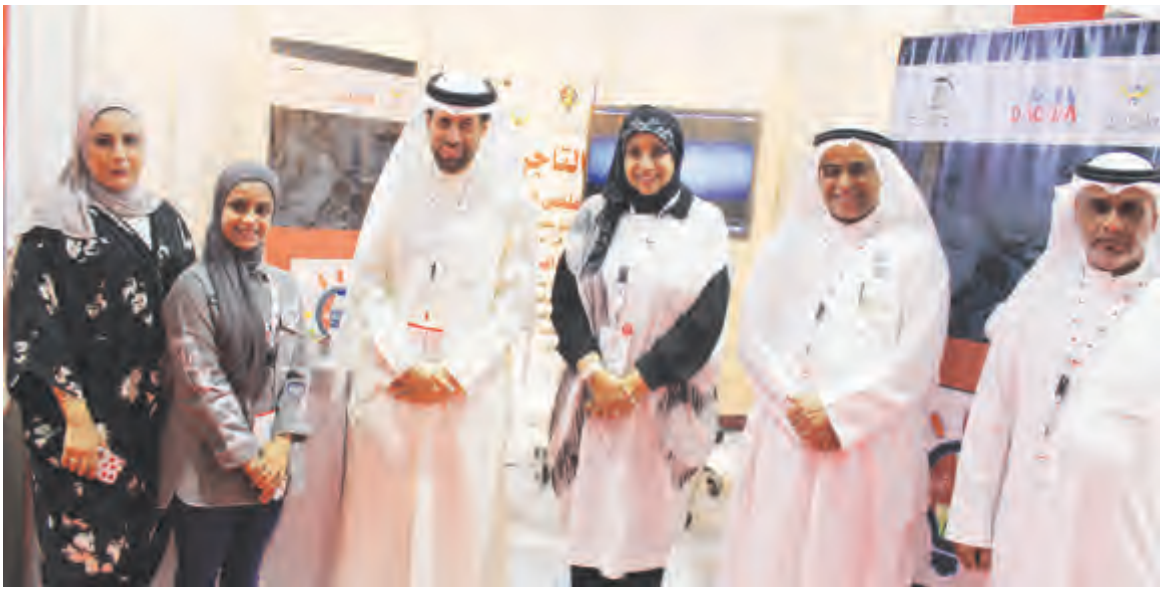
وقد برنامج إعادة الهيكلة المشارك في المعرض

المتميزه مبيّنا «ان شعار المسابقة يهدف الى بناء جيل قادر على المساهمة في بناء الاقتصاد الوطني المتنوع بايادي أبناء الكويت».