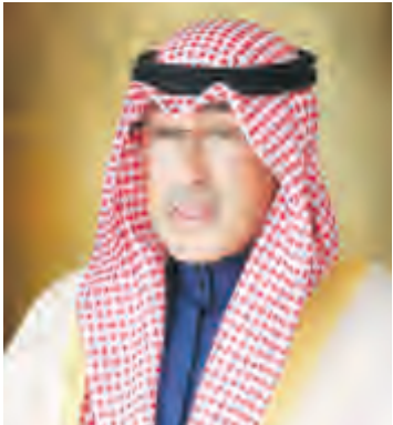
الشيخ فواز الخالد

يعاود محافظ الأحمدى الشيخ فواز الخالد استقبال أهالي محافظة الأحمدى ورواد ديوانية المحافظة الكرام، يوم الثلاثاء القادم الموافق 11 أبريل 2017 من الساعة 10 إلى الساعة 11 صباحاً، وذلك في ديوان عام محافظة الأحمدى – وعلى النحو المعتاد.