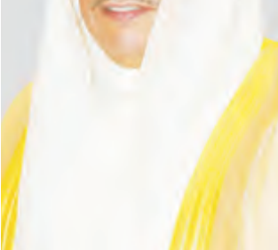
الشيخ خالد الجراح