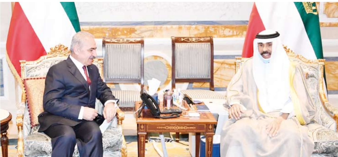
سمو الأمير مستقبلاً رئيس مجلس الوزراء بدولة فلسطين د.محمد اشتية

وزير الدولة لشؤون مجلس الوزراء الشيخ الدكتور أحمد ناصر محمد، ورئيس الديوان الأميري الشيخ مبارك الفيصل، ورئيس ديوان سمو رئيس مجلس الوزراء رئيس بعثة الشرف المرافقة عبدالعزيز الدخيل، ووكيل الديوان الأميري ومدير مكتب صاحب السمو أمير البلاد أحمد الفهد. كما استقبل سموه سمو الشيخ ناصر