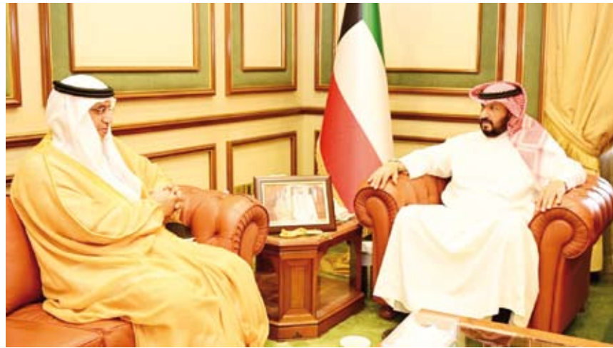
الشيخ طلال الخالد يستقبل سفير الإمارات العربية

أكد محافظ العاصمة، الشيخ طلال الخالد، قوة وتميز العلاقات الكويتية - الإماراتية، والتي تمتد جذورها عبر التاريخ، آملاً التوفيق والسداد للسفير الإماراتي لدى دولة الكويت الدكتور مطر حامد النبادي، في مهام منصبه الجديد في البلاد. جاء ذلك في تصريح صحفي للمحافظ الخالد، على هامش استقباله، أمس، في مكتبه بديوان عام المحافظة، سفير دولة الإمارات العربية المتحدة للشقيقة لدى الكويت الدكتور مطر النبادي، وذلك بمناسبة تسلمه مهام منصبه