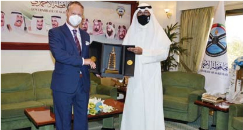
الشيخ فواز الخالد يقدم درعاً تذكارية لسفير النمسا

المحلية والمحافظات والمناطق على وجه الخصوص، وأهدى المحافظ الخالد للسفير ورباً في ختام اللقاء درعاً تذكارية، معرباً عن تمنياته له بالتوفيق والنجاح في الدفع بعلاقات الصداقة بين البلدين إلى آفاق أرحب. من جهته، عبر السفير ماريان ورباً عن سعادته وامتنانه لحفاوة استقبال المحافظ الخالد، معرباً عن التقدير البالغ للرعاية التي يحظى بها البعثة الدبلوماسية لبلاده ومواطنو جمهورية النمسا على الصعيدين الرسمي والشعبي في دولة الكويت.