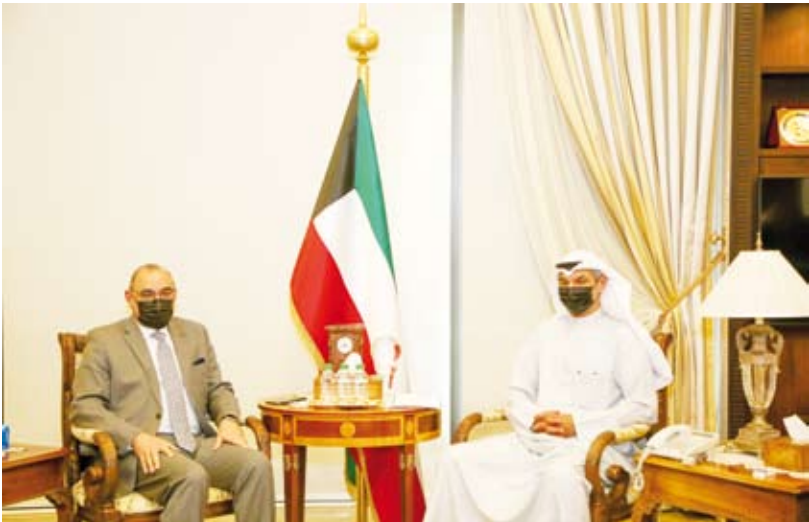
جانب من اللقاء

الإقليمية والدولية. وحضر اللقاء مساعد وزير الخارجية لشؤون مكتب نائب الوزير السفير أيهم العمر ونائب مساعد وزير الخارجية للشؤون القانونية المستشار سالم الشبلي.