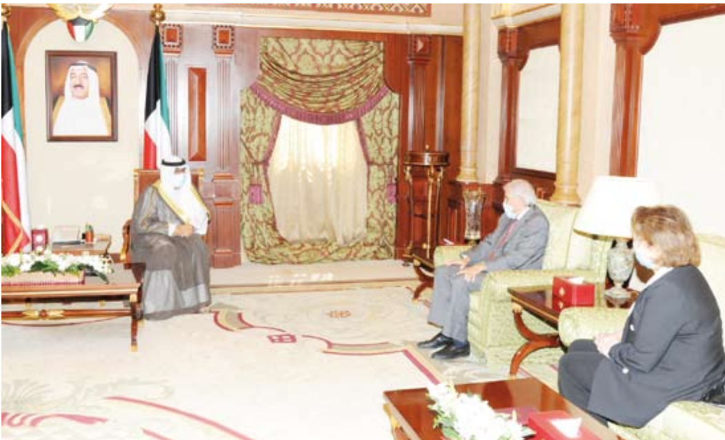
.. وسموه يستقبل السائر والبرجس