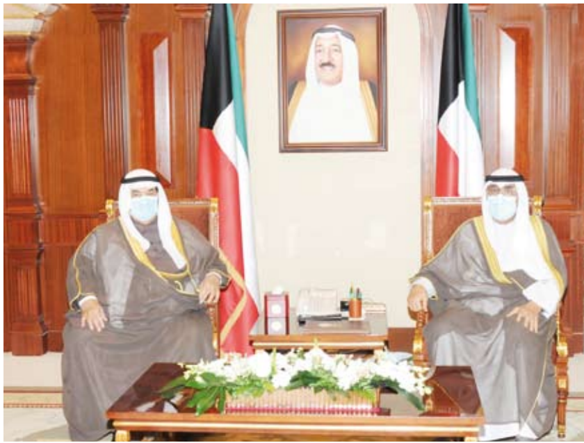
سمو ولي العهد يستقبل سمو الشيخ ناصر المحمد