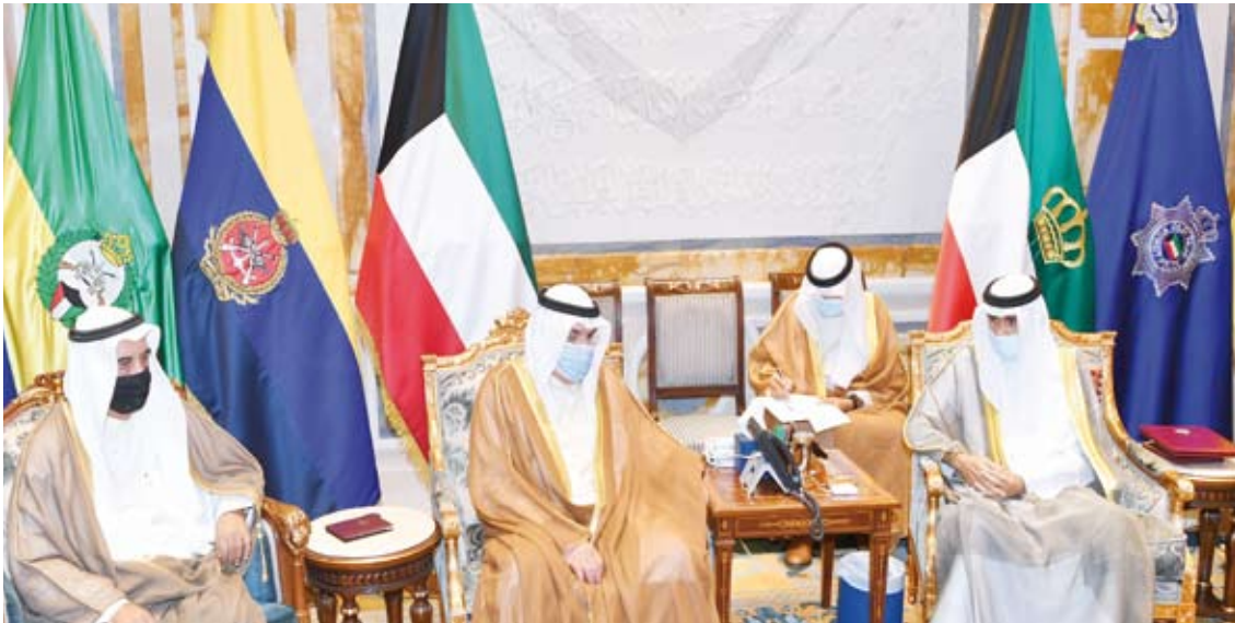
.. وسموه يستقبل رئيس وأعضاء غرفة التجارة والصناعة