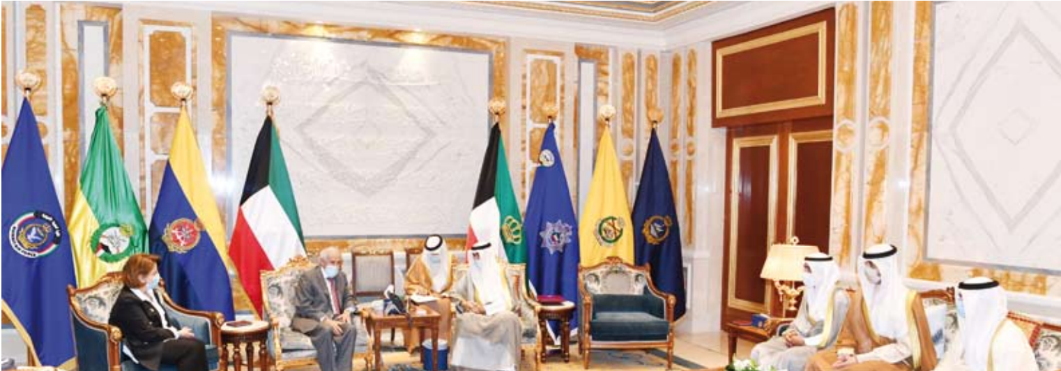
أمير البلاد يستقبل د. هلال السائر ومها البرجس

من جهة أخرى، فقد تلقى صاحب السمو أمير البلاد الشيخ نواف الأحمد، رسالتي تهنئة من الرئيس غاوتابايا راجاباسا رئيس جمهورية سريلانكا الصديقة، أعرب فيها عن خالص تهنائه وتأييده لحكومة وشعب جمهورية سريلانكا لسموه، بمناسبة توليه مقاليد الحكم، مشيداً بالعلاقات الوطيدة بين دولة الكويت وجمهورية سريلانكا الصديقة، كما ضمنها خالص تمنياته لسموه بدوام التوفيق والسداد. وقد بعث صاحب السمو أمير البلاد الشيخ نواف الأحمد، برسالة جوابية أعرب فيها عن بالغ شكره وتقديره على ما عبر عنه فخامته من قبض المشاعر الطيبة، مؤكداً سموه على التطلع والحرص المشترك لتعزيز العلاقات بين البلدين الصديقين والارتقاء باطر التعاون بينهما في مختلف المجالات إلى آفاق أرحب، ومتمنياً لسموه لفخامته وموفور الصحة والعافية ولبلد الصديق المزيد من التقدم والازدهار. كما تلقى صاحب السمو أمير البلاد الشيخ نواف الأحمد، برقية تهنئة من صاحب السمو الملكي الدوق الأكبر هنري دوق لوكسمبرغ الصديقة، أعرب فيها عن تهنائه لسموه، بمناسبة توليه مقاليد الحكم، مؤكداً فيها على الحرص ومواصلة تعزيز العلاقات الطيبة بين دولة الكويت ولوكسمبرغ الصديقة، كما ضمنها خالص تمنياته لسموه، بدوام التوفيق والسداد. وقد بعث صاحب السمو أمير البلاد الشيخ نواف الأحمد، ببرقية جوابية أعرب فيها عن خالص شكره وتقديره على ما عبر عنه سموه، من طيب المشاعر وصادق التمنيات، ومتمنياً لسموه موفور الصحة والعافية ولبلد الصديق المزيد من التقدم والازدهار.