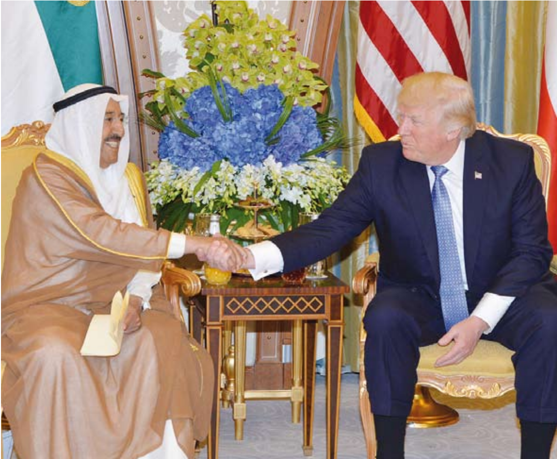
سمو أمير البلاد الشيخ صباح الأحمد والرئيس الأمريكي دونالد ترامب في لقاء سابق

وبعث سمو نائب الأمير وولي العهد الشيخ نواف الأحمد ببرقية تهنئة إلى الرئيس إمام علي رحمان رئيس جمهورية طاجيكستان الصديقة ضمنها سموه خالص تهانيه بمناسبة العيد الوطني لبلاده راجيا لفخامته موفور الصحة والعافية. كما بعث صاحب السمو أمير البلاد الشيخ صباح الأحمد ببرقية تهنئة إلى المارشال كيم جونغ أون رئيس حزب العمل الكوري رئيس لجنة الشؤون الوطنية لجمهورية كوريا