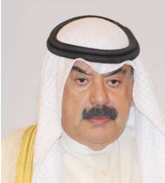
خالد الجار الله

ونائب مساعد وزير الخارجية لشؤون مكتب الشطي.