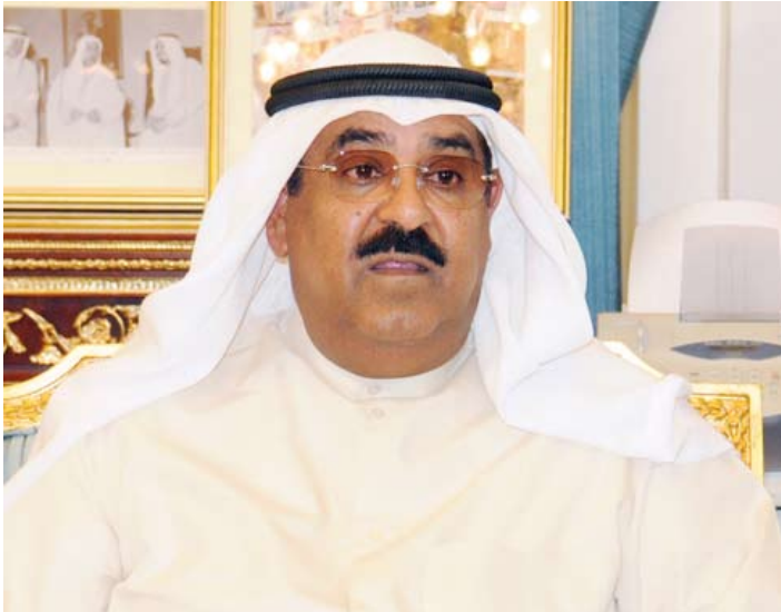
الشيخ مشعل الأحمد

مسيرتكم الدؤوبة في العطاء الإنساني ونهجكم الدبلوماسي المستمر في مد يد العون للأشقاء والأصدقاء في مختلف بقاع العالم وما لذلك من مساهمة في تخفيف الآلام وتخطي الأزمات والنصدي للكوارث والعقبات. وختاماً نؤكد لسموكم فخرنا