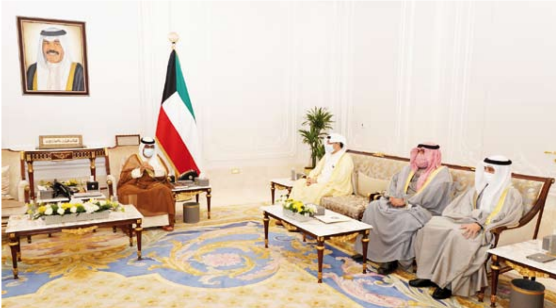
.. وسموه يستقبل وزراء الدفاع والخارجية والداخلية

استقبل سمو ولي العهد الشيخ مشعل الأحمد، بقصر بيان، صباح أمس، رئيس مجلس الأمة مرزوق الغانم. كما استقبل سمو ولي العهد، سمو الشيخ صباح الخالد رئيس مجلس الوزراء.