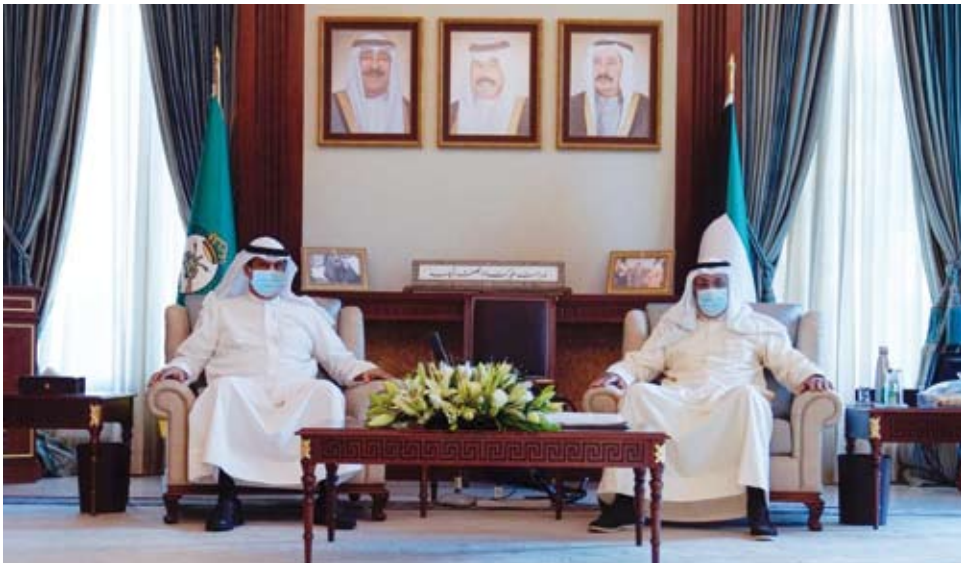
الشيخ أحمد النواف يستقبل محافظ «حولي»

استقبل الفريق أول متقاعد الشيخ أحمد النواف نائب رئيس الحرس الوطني في ديوانه بالرئاسة العامة للحرس الوطني، محافظ حولي علي سالم الأصغر.