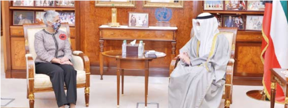
الشيخ الدكتور أحمد ناصر المحمد يستقبل سفيرة كندا عليا مواني

مواني، وذلك خلال اللقاء الذي تم صباح أمس، في ديوان عام (الخارجية). وتمنى الشيخ الدكتور أحمد ناصر المحمد، للسفيرة الجديدة التوفيق في مهام