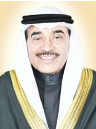
سمو الشيخ صباح الخالد

خلال الإتصال الهاتفي مع نظيره العراقي عن بالغ شجبه واستنكاره لمحاولة الاغتيال الآثمة التي تعرض لها، وأكد تأييد دولة الكويت لكافة الإجراءات التي يتخذها العراق في مواجهة هذه الأعمال الإرهابية.