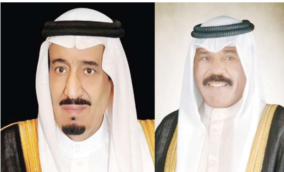
خادم الحرمين الشريفين الملك سلمان بن عبدالعزيز