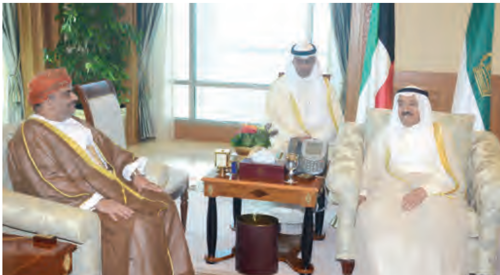
امير البلاد يستقبل السفير العماني حامد بن سعيد آل إبراهيم