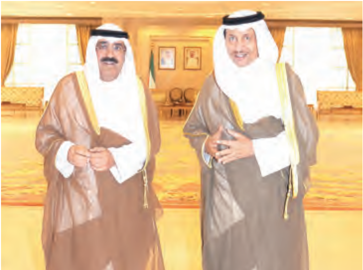
سمو الشيخ جابر المبارك يستقبل الشيخ مشعل الأحمد

رئيس مجلس الوزراء ووزير الدفاع الكويتي الشيخ محمد الخالد الحمد الصباح لدعمه ورعايته هذا الملئقي ولرئيس الأركان العامة للجيش الفريق الركن محمد الخضر على تشجيعه الدائم لهذه الفعاليات.