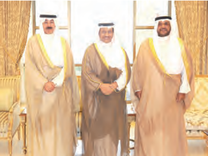
.. ويستقبل الشيخين محمد الخالد وأحمد المنصور