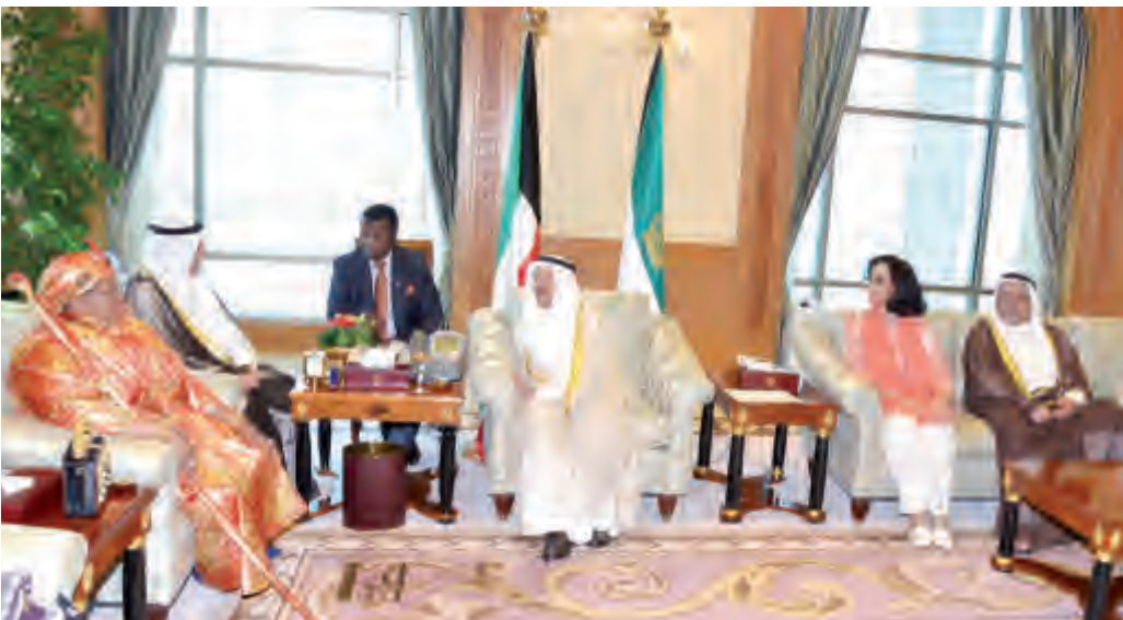
أمير البلاد يستقبل الملكة الأم نتومبي سوازيلاند

استقبل صاحب السمو أمير البلاد الشيخ صباح الأحمد بقصر السيف صباح أمس رئيس مجلس الأمة مرزوق الغانم ورئيس مجلس النواب السويسري بيروغ شتال والوفد المرافق وذلك بمناسبة زيارته للبلاد.