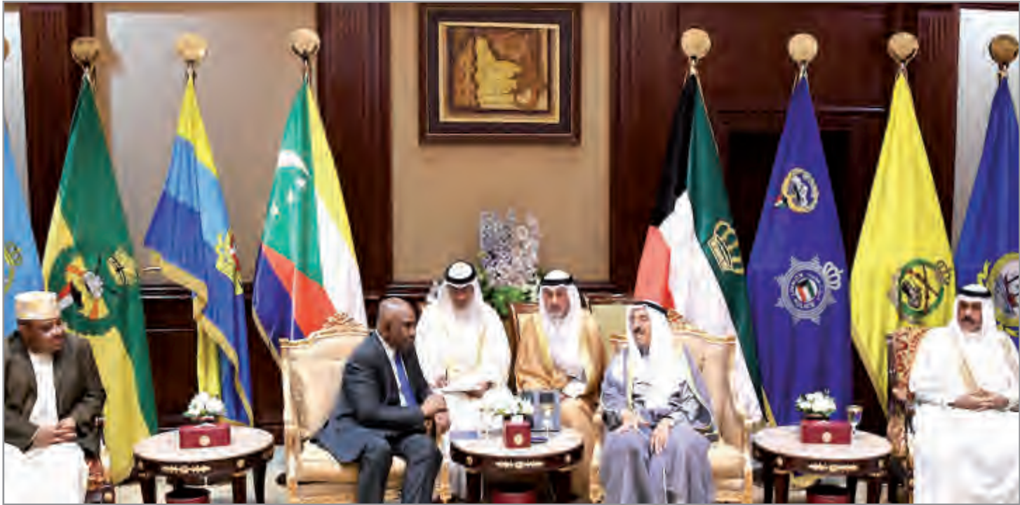
جانب من المباحثات الرسمية بين البلدين

في حين قلد فخامته سموه وسام الهلال الأكبر من مرتبة (الهلال الأخضر القمري) وهو أعلى وسام شرف بجمهورية القمر المتحدة الشقيقة وذلك تقديرا للخدمات المقدمة للأمة.