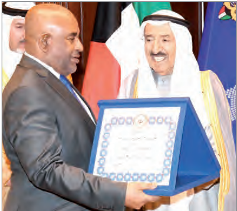
أمير البلاد يتبادل يقلد رئيس جمهورية القمر المتحدة قلادة مبارك الكبير

غداً على شرف الرئيس عثمان غزالي رئيس جمهورية القمر المتحدة الشقيقة والوفد الرسمي المرافق لفخامته وذلك بمناسبة زيارته الرسمية للبلاد.