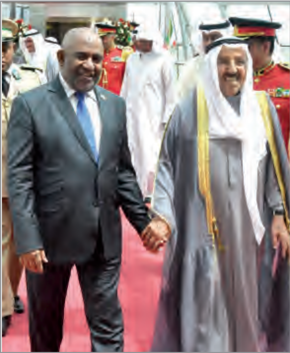
سمو أمير البلاد مستقبلاً رئيس جمهورية القمر في المطار