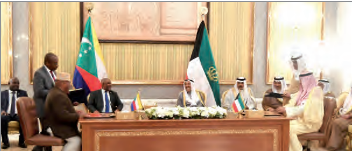
.. وجانب من توقيع الاتفاقية

شيخان وعدد من كبار المسؤولين بجمهورية القمر المتحدة الشقيقة. وقد أقام صاحب السمو أمير البلاد الشيخ صباح الأحمد بقصر بيان ظهر أمس مأدبة