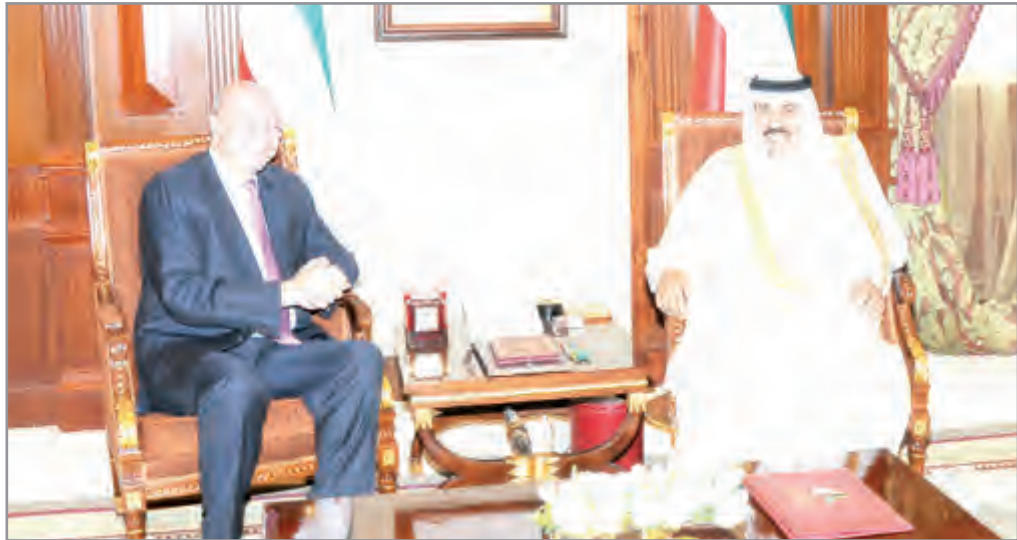
سمو ولي العهد يستقبل رئيس مجلس الأعيان الأردني

استقبل سمو ولي العهد الشيخ نواف الأحمد بقصر بيان صباح أمس فيصل عاكف الفايز رئيس مجلس الأعيان الأردني وذلك بمناسبة زيارته للبلاد.