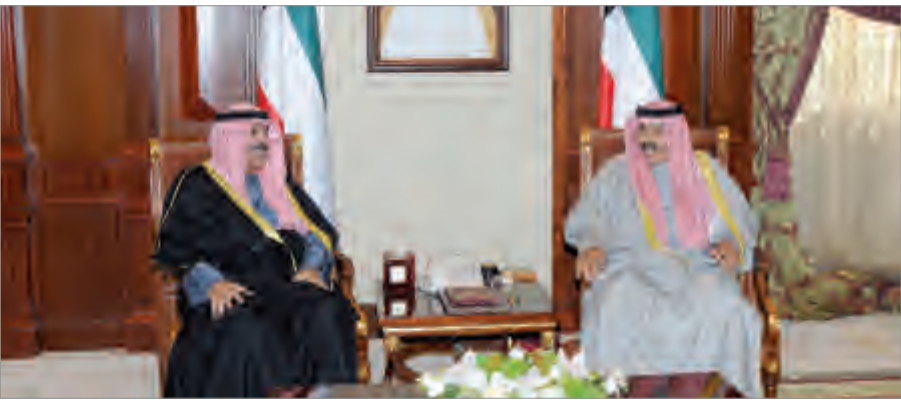
سمو ولي العهد يستقبل الشيخ مشعل الأحمد