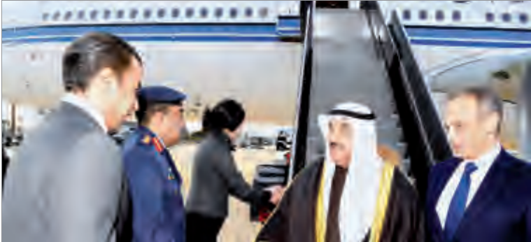
سمو الشيخ ناصر المحمد لدى وصوله إلى واشنطن

للوليات المتحدة الأمريكية الصديقة. وقد كان في استقبال ممثل سموه سفير دولة الكويت لدى الولايات المتحدة الأمريكية الشيخ سالم عبدالله الجابر الصباح وأعضاء السفارة.