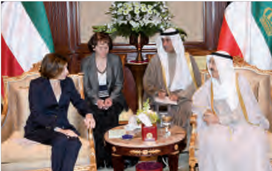
... وسموه يستقبل وزيرة القوات المسلحة في فرنسا فلورنس بارلي