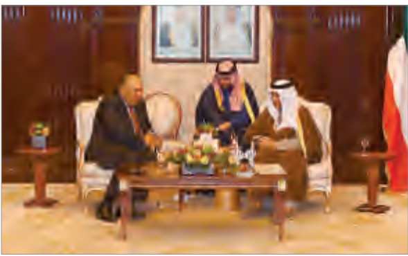
سمو الشيخ جابر المبارك يستقبل سامح شكري والوفد المرافق

استقبل سمو الشيخ جابر المبارك رئيس مجلس الوزراء وبحضور نائب رئيس مجلس الوزراء ووزير الخارجية الشيخ صباح الخالد في قصر بيان أمس وزير خارجية جمهورية مصر العربية الشقيقة سامح حسن شكري والوفد المرافق له وذلك