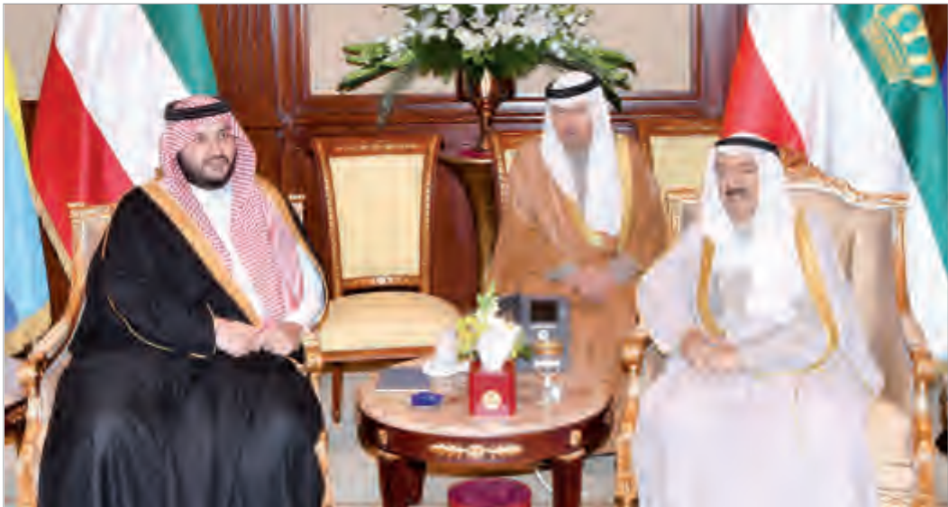
سمو الأمير يستقبل الأمير تركي بن محمد بن فهد بن عبدالعزيز