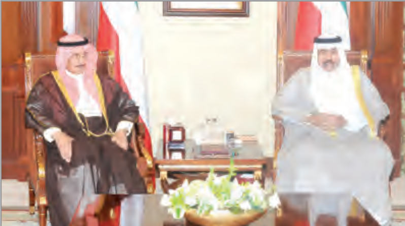
سمو ولي العهد يستقبل د. إبراهيم الدعيج

واستقبل سمو ولي العهد نائب رئيس مجلس الأسرة الحاكمة الشيخ الدكتور إبراهيم الدعيج.