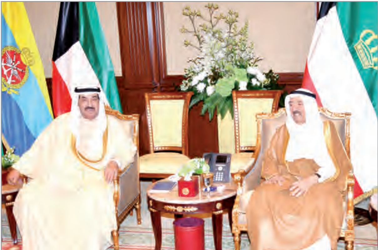
أمير البلاد يستقبل سمو الشيخ ناصر المحمد

جمهورية مدغشقر الصديقة ضمنها سموه خالص تهانيه بمناسبة العيد الوطني لبلاده متمنيا لفخامته موفور الصحة والعافية. كما بعث سمو الشيخ جابر المبارك رئيس مجلس الوزراء ببرقية تهنئة مماثلة.