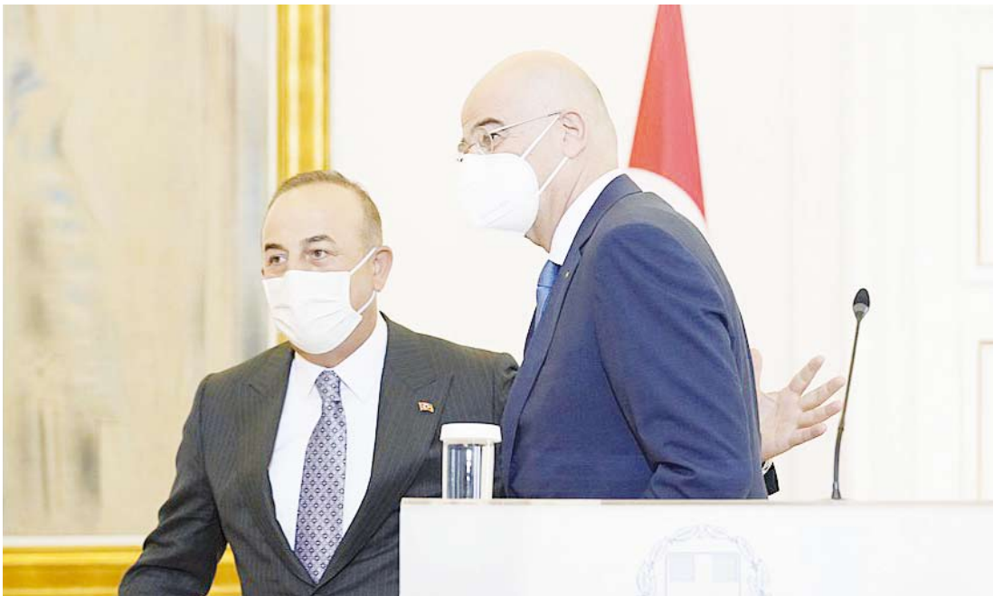
وزير خارجية تركيا واليونان في أثينا أمس

أعلن وزير الخارجية التركي مولود جاويش أوغلو أمس توصل بلاده الى اتفاق مع اليونان حول العديد من القضايا محل الاهتمام المشترك.