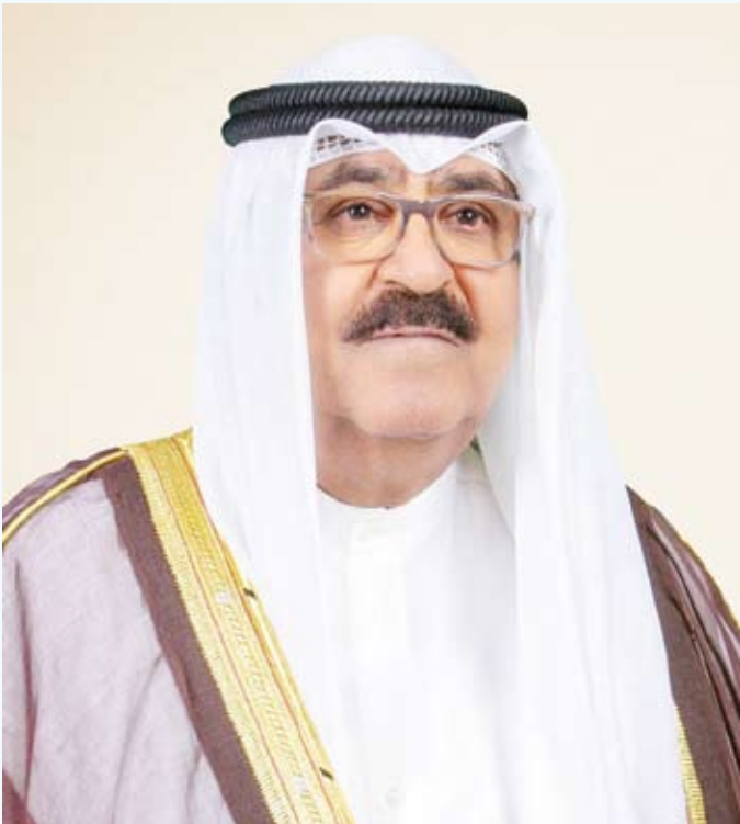
سمو ولي العهد الشيخ مشعل الأحمد الجابر الصباح

تأتي زيارة سمو ولي العهد الشيخ مشعل الأحمد للمملكة العربية السعودية وهي أولى زياراته الرسمية والمقررة اليوم الثلاثاء شاهدا على متانة العلاقات بين البلدين الشقيقين. وتعد زيارة سموه التي تأتي تلبية لدعوة ولي العهد السعودي نائب رئيس مجلس الوزراء وزير الدفاع الأمير محمد بن سلمان لترسخ عمق العلاقات الوطيدة والمتجذرة بين البلدين. وعن هذه الزيارة قال سفير دولة الكويت لدى المملكة العربية السعودية الشيخ علي الخالد انها زيارة تاريخية ومهمة كونها أول زيارة لسموه منذ التزكية السامية لسموه وليا للعهد،