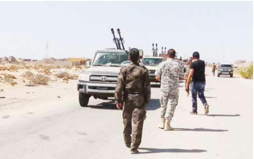
هل يعود الهدوء إلى ليبيا

من جانبه فقد رحب الاتحاد الأوروبي بحرارة أمس بقراري