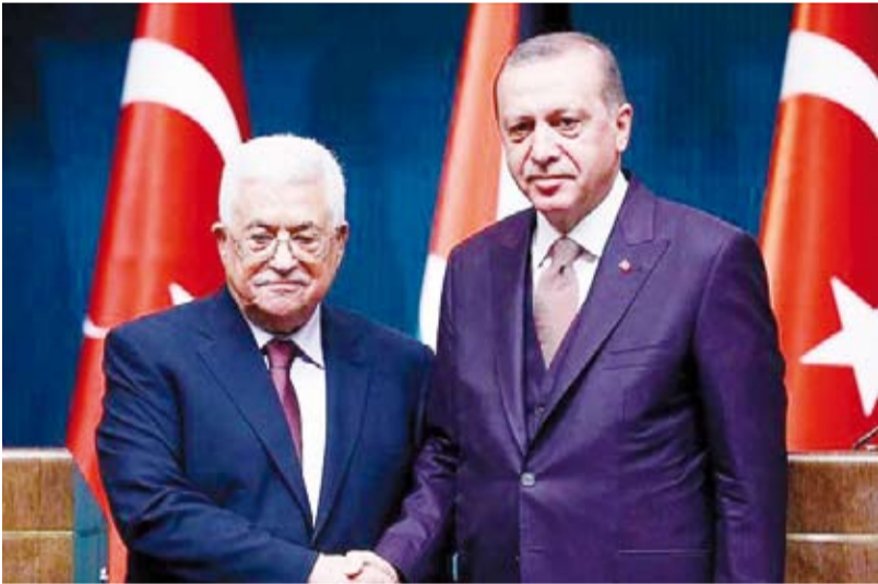
جانب من لقاء سابق بين أردوغان وعباس

جدد الرئيس التركي رجب طيب أردوغان، دعم بلاده لقضية فلسطين العادلة، خلال اتصال هاتفي مع نظيره الفلسطيني محمود عباس. وأفاد بيان صادر عن دائرة الاتصال في الرئاسة التركية، أمس السبت، أن أردوغان وعباس تناولا، خلال الاتصال، العلاقات الثنائية بين البلدين. وأضاف البيان أن أردوغان جدد تأكيد لعباس على دعم تركيا قضية فلسطين العادلة. كما قدم الرئيس الفلسطيني تهانيه لأردوغان بمناسبة اكتشاف بلاده حقلا كبيرا للغاز الطبيعي، لافتا إلى أن نجاح تركيا يعتبر بمثابة نجاح لفلسطين، بحسب البيان.