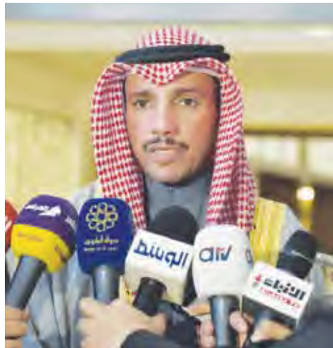
الفانم مصرحاً للصحافيين

السعودية تنفي افتتاح سفارتها في دمشق.. وقطر تستبعد تطبيع العلاقات نفت المملكة العربية السعودية تصريحاً منسوباً لوزير الخارجية إبراهيم العساف بشأن افتتاح سفارة لها في العاصمة السورية دمشق. ونقلت وكالة الأنباء السعودية عن مصدر مسؤول بوزارة الخارجية نفيه للتصريح المزعوم، موضحاً أن التصريح لا صحة له جملة وتفصيلاً. كما استبعد وزير خارجية قطر الشيخ محمد بن عبد الرحمن آل ثاني إعادة تطبيع العلاقات مع