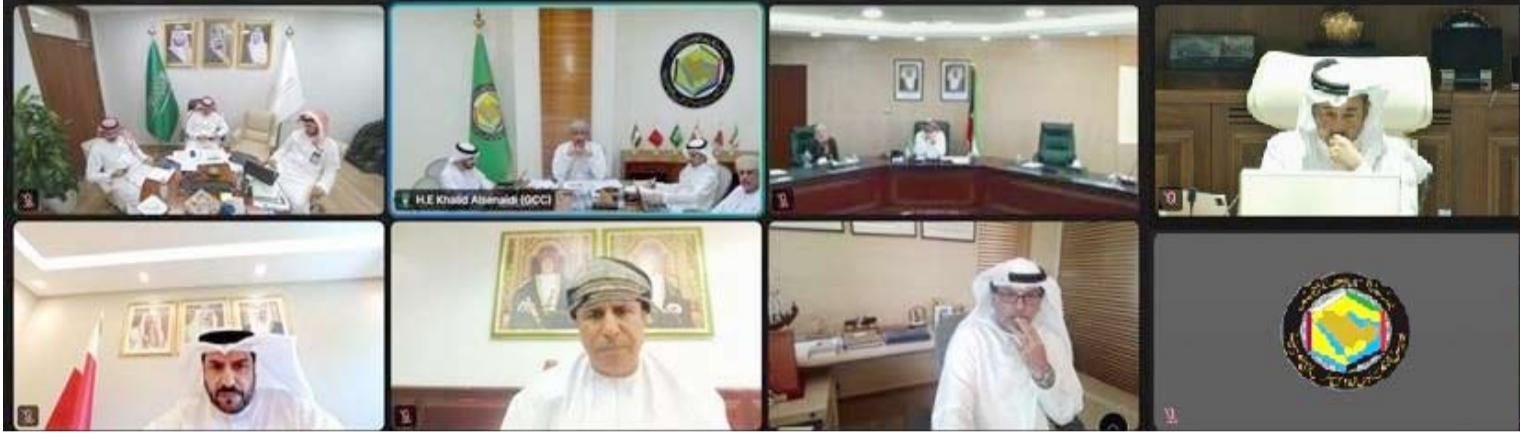
وكلاء وزارات الزراعة خلال الاجتماع

واختتم الاجتماع بالتأكيد على مواصلة تنفيذ مبادرات إستراتيجية الأمن الغذائي لدول مجلس التعاون التي أقرتها اللجنة الوزارية للتعاون الزراعي والأمن الغذائي في اجتماعها (37) المنعقد في نوفمبر 2025 بدولة الكويت بما يعزز استدامة الأمن الغذائي في دول المجلس.