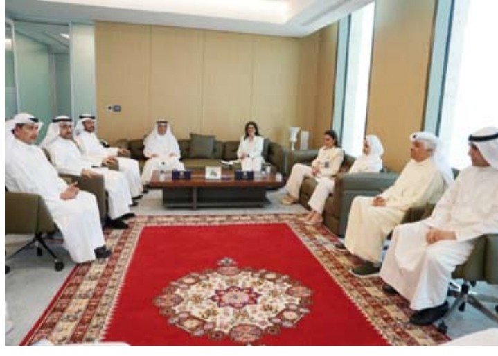
رئيس المجلس الأعلى للقضاء يستقبل رئيس وأعضاء مجلس إدارة (نزاهة)

في اجنثا واستئصال كل أوجه وصور وأساليب الفساد في الدولة وضمان النزاهة والشفافية والإستقامة في مجالات العمل العام والخاص وإنفاذ القانون على الكافة. كما استعرض الحضور الإجراءات التي اتخذتها الهيئة في سبيل مكافحة الفساد وقد تم الاتفاق على التنسيق والتعاون بين الأجهزة القضائية والهيئة لاتخاذ مزيد من الإجراءات الجادة من أجل محاربة كافة أنماط الفساد وحماية الخزينة العامة للدولة.