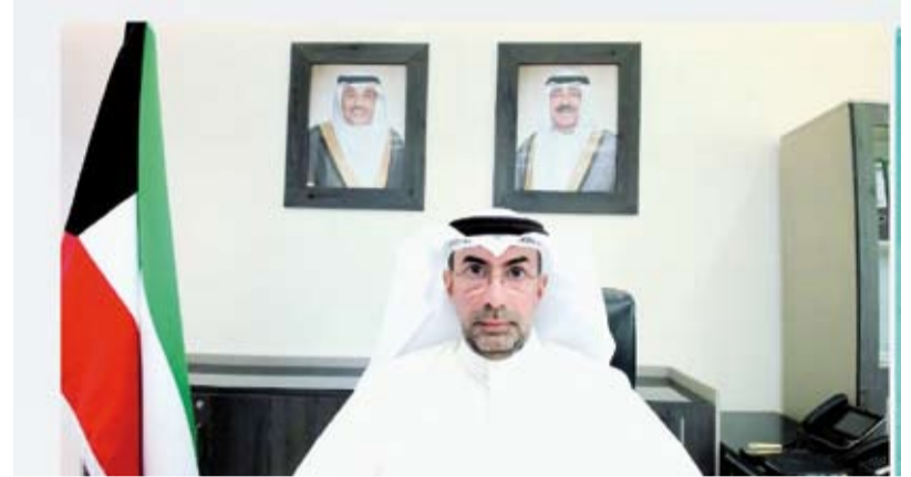
د. ناصر محيسن خلال الاجتماع عبر الاتصال المرئي

تم اتخاذ إجراءات تشغيلية عاجلة لضمان استمرارية الخدمات وسلامة الجميع شملت تنظيم حركة الطيران وفق متطلبات السلامة إلى جانب تفعيل بدائل لوجستية بالتنسيق مع المملكة العربية السعودية لتسهيل حركة المسافرين. وأضاف أن الكويت اتخذت إجراءات إنسانية استثنائية تمثلت في التمدد التلقائي المجاني لسماوات الدخول والزيارة وعدم تحميل الزوار أي تبعات قانونية أو مالية بما يعكس التزامها بحماية الزوار وصون حقوقهم. فيما أكد الوزراء -بحسب البيان الختامي للاجتماع- جاهزية القطاع السياحي الخليجي واستمراريته مدعوماً ببنية تحتية متقدمة وكفاءة تشغيلية عالية مع استمرار الوجهات الخليجية في استقبال الزوار وفق أعلى معايير السلامة. وجدد الوزراء إبانتهم للاعتداءات التي استهدفت البنية التحتية والمنشآت الحيوية مؤكداً رفضهم لأي ممارسات تمس سيادة الدول أو تهدد أمنها واستقرارها. كما شدوا على أن سلامة الزوار تمثل أولوية قصوى مع التأكيد على التزام دول المجلس بدعم الاستثمارات السياحية وتعزيز التعاون والتكامل وتطوير خطط استجابة مشتركة لمواجهة أي مستجدات بما يحافظ على استقرار القطاع ويعزز مكانة دول المجلس كوجهات سياحية آمنة وجاذبة.