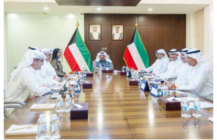
سمو الشيخ أحمد عبدالله بن ترأس الاجتماع

الاستثمار الاقتصادي والاستثمار المباشر من قبل القطاع الخاص، ووزير الدولة لشؤون البلدية ووزير الدولة لشؤون الإسكان عبداللطيف المشاري، ووزير الكهرباء والماء والطاقة المتجددة الدكتور صبيح المخيزيم، ووزير التجارة والصناعة أسامة بودي، ووزير الدولة للشؤون