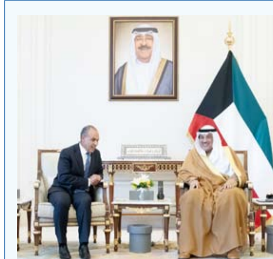
سمو ولي العهد مستقبلاً وزير الخارجية المصري