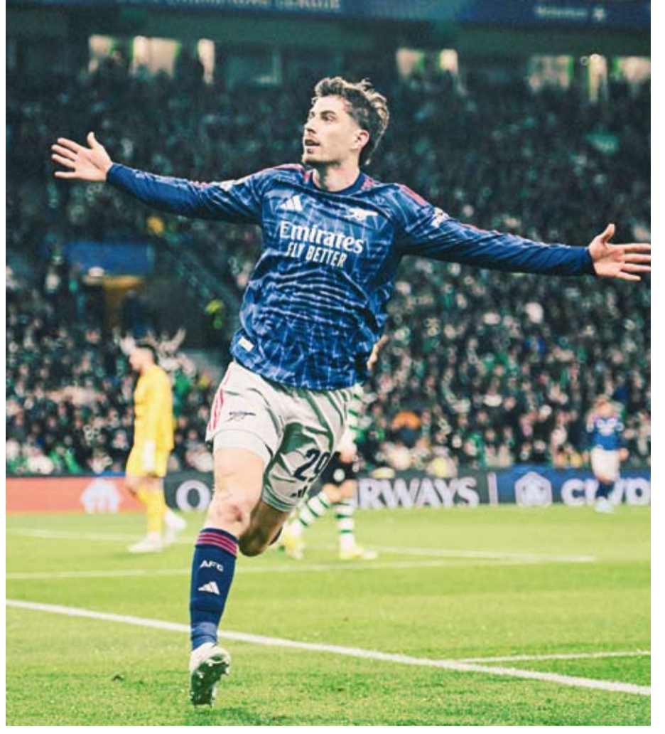
كاي هافيرتس يحتفل بهدف اللقاء