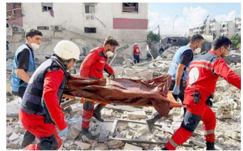
مجازر صهيونية شهدها لبنان أمس

قالت الوكالة الوطنية للإعلام اللبنانية أمس إن قوات الاحتلال وسعت غاراتها الجوية على لبنان شاملة العاصمة بيروت وضواحيها. وذكرت الوكالة أن طيران الاحتلال شن سلسلة غارات استهدفت في بيروت مناطق بربور وكورنيش المزرعة وعين المريسة وبرج أبي حيدر. وأشارت إلى أن الغارات استهدفت الضاحية الجنوبية لبيروت وبلدة وعرمون ومدينة صيدا. وقال وزير الصحة العامة اللبناني إن الغارات أدت إلى سقوط مئات القتلى والجرحى في مختلف أنحاء لبنان.