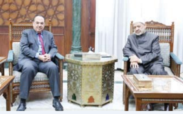
د. أحمد الطيب يلتقي سفير الكويت لدى مصر غانم الغانم

أكد شيخ الأزهر الشريف الدكتور أحمد الطيب، أول أمس، إدانة الأضرار الإيرانية للاعتداءات الإيرانية على دول الخليج والأردن والعراق التي تستهدف المنشآت المدنية وتعرض حياة المدنيين للخطر، جاء ذلك في لقاء جمع سفير دولة الكويت لدى مصر غانم الغانم شيخ الأزهر بحثاً خلاله تعزيز التعاون المشترك. وقال السفير الغانم في تصريح له (كونا) عقب اللقاء: إن الطيب شدّد خلال اللقاء على ضرورة صون أمن الشعوب واستقرارها وتعزيز الأمن والاستقرار في المنطقة، وأضاف أن شيخ الأزهر أكد أيضاً عمق العلاقات الأخوية التي تربط مصر والأزهر الشريف بدولة الكويت، مشيداً بما تشهده من تطور في مختلف المجالات، من جانبه، أشاد سفير دولة الكويت لدى مصر بدور الأزهر الشريف في نشر الدين الصحيح وترسيخ قيم الوسطية والاعتدال وتعزيز ثقافة السلام العالمي والأخوة الإنسانية.