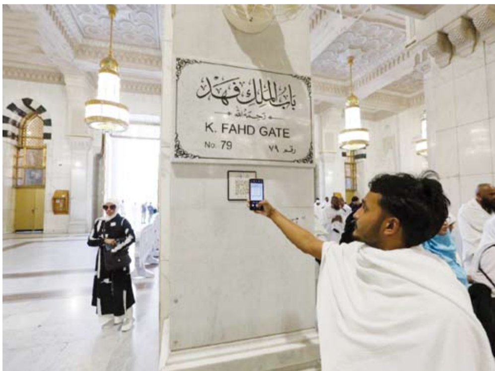
الوصول المباشر إلى الخدمات الرقمية بسهولة

تتجلى في رحاب المسجد الحرام ملامح التحول الرقمي في منظومة الخدمات الدينية، عبر توظيف التقنيات الحديثة التي تسهم في تسهيل رحلة القاصدين والمعتمرين، وتمكنهم من الوصول إلى باقة متنوعة من الخدمات الإرشادية والعلمية المقدمة داخل المسجد الحرام. وأتاحت رئاسة الشؤون الدينية بالمسجد الحرام والمسجد النبوي منصة بوابة القاصدين خلال استخدام تقنيات الاستجابة السريعة (QR) في عدد من المواقع داخل المسجد الحرام، بما يمكن الزوار والمعتمرين من الوصول