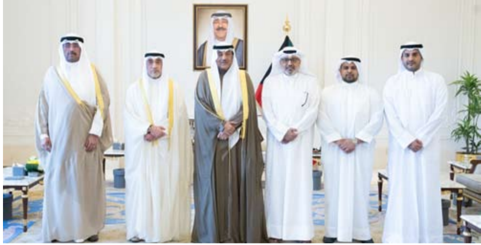
سمو ولي العهد يستقبل أسرة شهيد الواجب الرائد فهد المجدد

استقبل صاحب السمو أمير البلاد الشيخ مشعل الأحمد، أمس، النائب الأول لرئيس مجلس الوزراء ووزير الداخلية الشيخ فهد اليوسف ووزير الدفاع الشيخ عبدالله العلي وأسرة شهداء الواجب -المغفور لهم بإذن الله تعالى- الرقيب وليد سليمان، والرقيب عبدالعزيز ناصر من منتسبي القوة البحرية بالجيش الكويتي، والمقدم ركن عبدالله الشراح والرائد فهد المجدد من منتسبي الإدارة العامة لأمن الحدود البرية بوزارة الداخلية، والذين استشهدوا أثناء قيامهم بواجبهم الوطني في إطار المهام الوطنية المنوطة بهم في التصدي والردع للاعتداء الإيراني الأثم على دولة الكويت. كما استقبل سموه، أسرة الشهيذة الطفلة من الجنسية الإيرانية لنا عبدالله حسين، التي استشهدت إثر تعرض منزل أسرتها للقصف خلال الاعتداءات الأثمة من قبل صواريخ العدوان الإيراني الغاشم على المواقع المدنية بدولة الكويت.