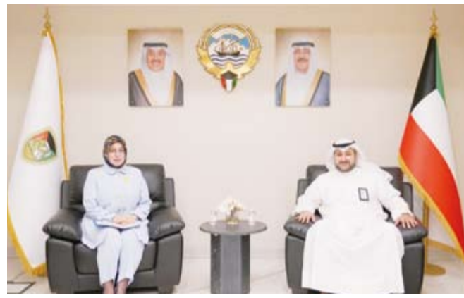
وكيل وزارة الدفاع مستقبلاً سفير تركيا لدى الكويت

اعربت وزارة الخارجية عن إدانة واستنكار دولة الكويت لاقتحام وزير في حكومة الاحتلال الإسرائيلي للمسجد الأقصى المبارك تحت حماية قوات الاحتلال في انتهاك حسيم للقانون الدولي والقانون الإنساني. وأكدت (الخارجية) في بيان لها، أمس، رفض دولة الكويت القاطع لكافة الممارسات الاستنزائية التي تمس بالوضع القانوني والتاريخي القائم في القدس ومقدساتها مجددة دعوتها للمجتمع الدولي إلى تحمل مسؤولياته لوقف هذه الانتهاكات، وجددت موقف دولة الكويت الثابت والداعم للقضية الفلسطينية وحقوق الشعب الفلسطيني الشقيق المشروعة وفي مقدمتها إقامة دولته المستقلة على حدود عام 1967 وعاصمتها القدس الشرقية.