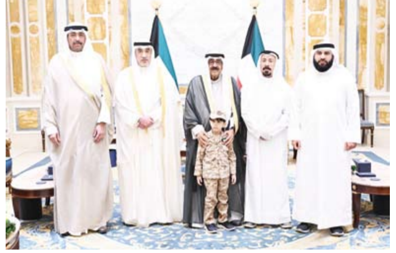
سمو أمير البلاد مستقبلاً أسرة شهيد الواجب الرقيب وليد سليمان