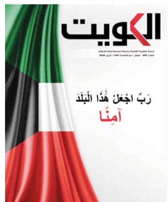
غلاف العدد الجديد من مجلة الكويت

أصدرت وزارة الإعلام عدداً جديداً من «مجلة الكويت» لشهر أبريل الجاري، من خلال فتح نافذة متعددة على قضايا تمس جوهر الدولة والمجتمع، وتجمع بين السيادة والوعي، وبين الإبداع والمسؤولية.