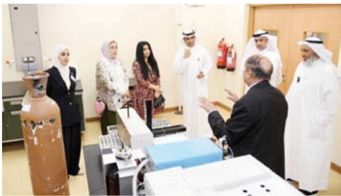
الفجاء وبهيهاني والوفد المرافق خلال الاطلاع على إمكانات المختبرات

لدى هذه المختبرات بما يسهم في دعم خطط التعامل مع المستجدات وتعزيز الجاهزية المؤسسية. وأكد الجانبان (حسب البيان) ضرورة تعزيز التعاون وأهمية التكامل بين الجهات الحكومية من خلال تبادل الخبرات والإمكانات بما يرفع كفاءة الأداء المؤسسي ويوحد الجهود لمواجهة التحديات الراهنة. كما شدد على ضرورة مواصلة تعزيز التعاون المشترك في مختلف الجوانب الفنية والتقنية والتدريبية وتفعيل بنود الاتفاقية المشتركة بينهما بما يخدم المصلحة الوطنية ويتماشى مع توجيهات مجلس الوزراء الداعية إلى تكامل الأدوار وتضافر الجهود بين مؤسسات الدولة.