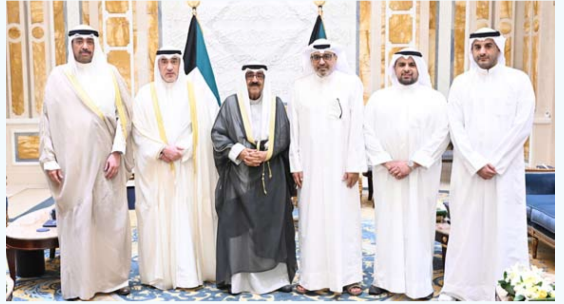
صاحب السمو مستقبلاً ذوي الشهداء

الاعتداءات الأتمة من قبل صواريخ العدوان الإيراني الغاشم على المواقع المدنية بدولة الكويت.