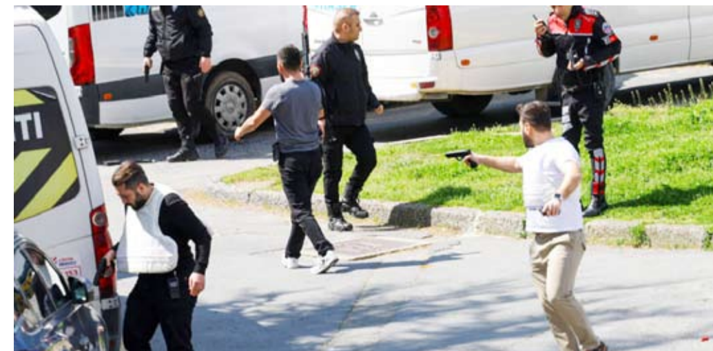
جانم من تبادل إطلاق النار بين الامن والمهاجرين

إصابة شرطيّين بحدوث إطلاق نار قرب قنصلية الاحتلال. وقد أفادت وكالة رويترز بسماع دوي إطلاق نار بالقرب من البناية التي تضم القنصلية الإسرائيلية في مدينة إسطنبول