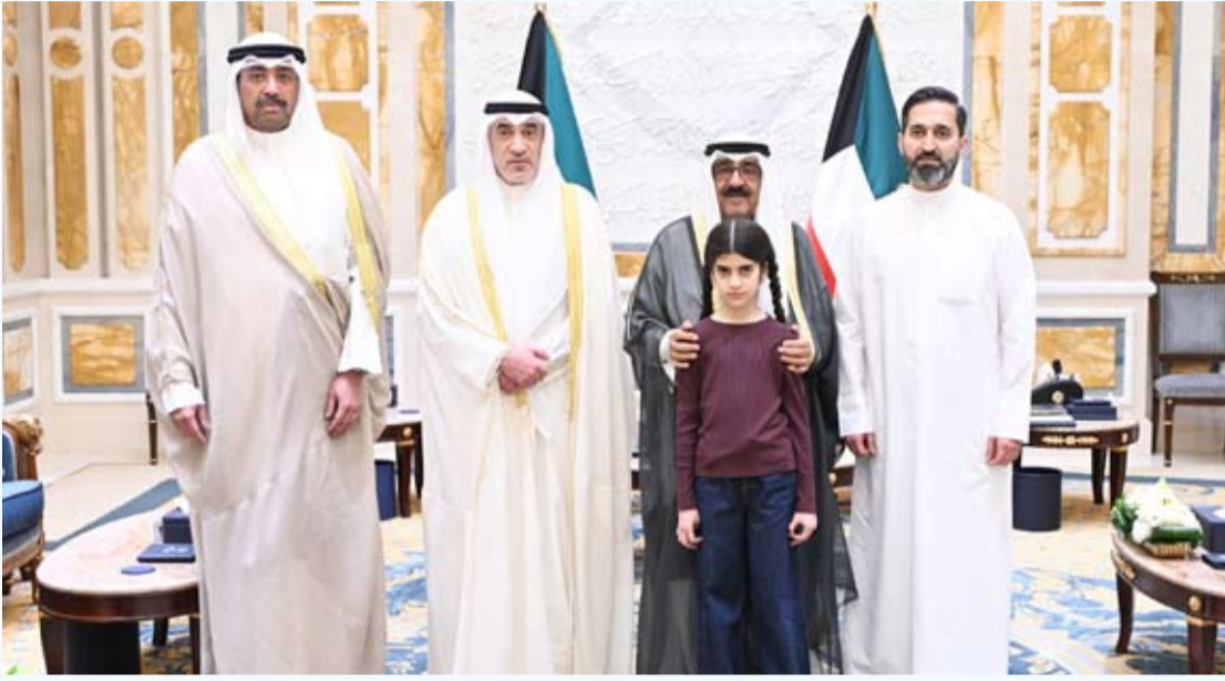
سمو الأمير خلال استقبال أسرة الشهيذة الإيرانية