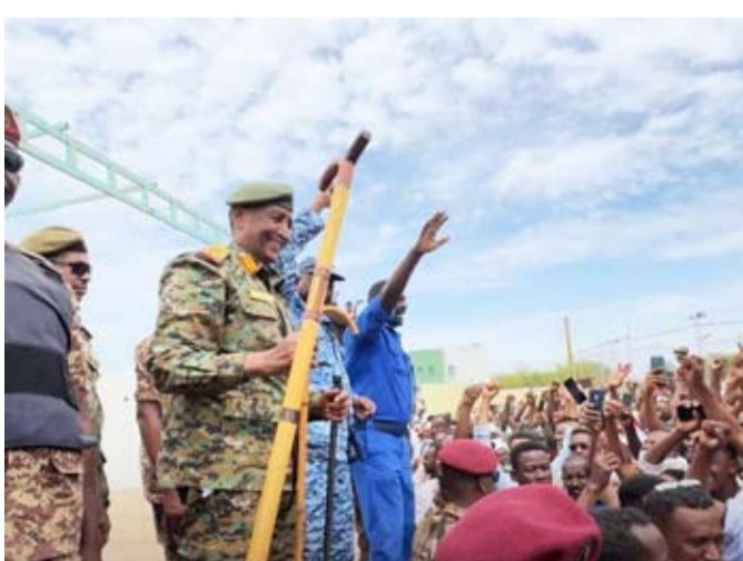
البرهان أثناء زيارته مدينة الدندر بولاية سنار

من جهة أخرى، أشاد البرهان، في بيان بمناسبة ذكرى السادس من أبريل (ذكرى انتفاضة شعبية أطاحت بالخير عبد الله ناصر درجام نائباً لرئيس هيئة الأركان، ومحمد علي أحمد صبير رئيساً لهيئة الاستخبارات العسكرية.