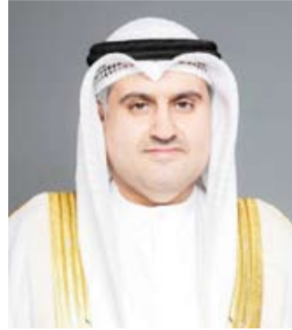
وزير العدل المستشار ناصر السميذ

طلبت إثبات أو نفي النسب وطلبات تغيير أو تصحيح الأسماء بما يتخل