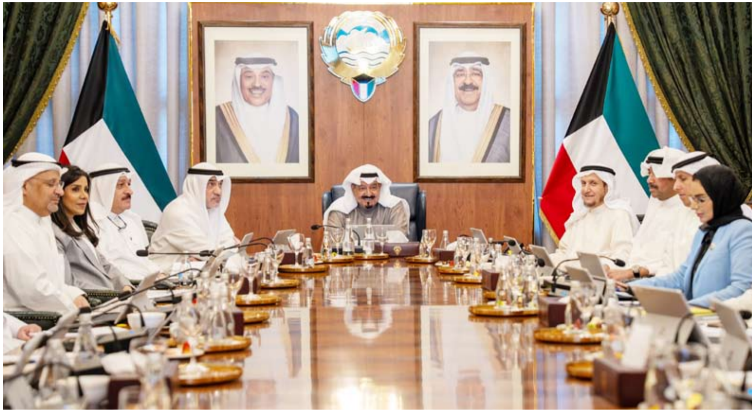
العبدالله يترأس اجتماع مجلس الوزراء أمس

كما أحيط مجلس الوزراء علماً بأخر تحركات بعثات دولة الكويت الدبلوماسية في الخارج حيال التطورات التي تشهدها المنطقة.