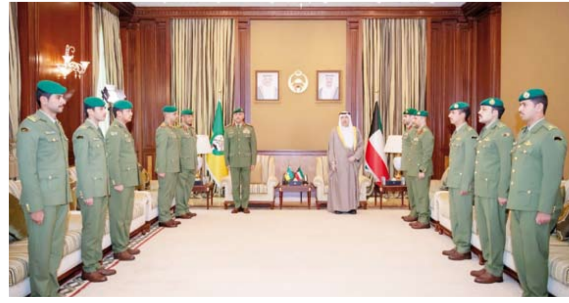
الشيخ مبارك الحمود خلال أداء عدد من الضباط القسم القانوني

علمياً بابتعانهم إلى المؤسسات الأكاديمية العسكرية الراقية في الدول الشقيقة والصديقة، داعياً الله تعالى أن يحفظ الكويت من كل مكروه وسوء في ظل قيادتها الحكيمة. وحضر أداء القسم القانوني وكيل الحرس الوطني الفريق الركن حمد البرجس وكبار القادة.