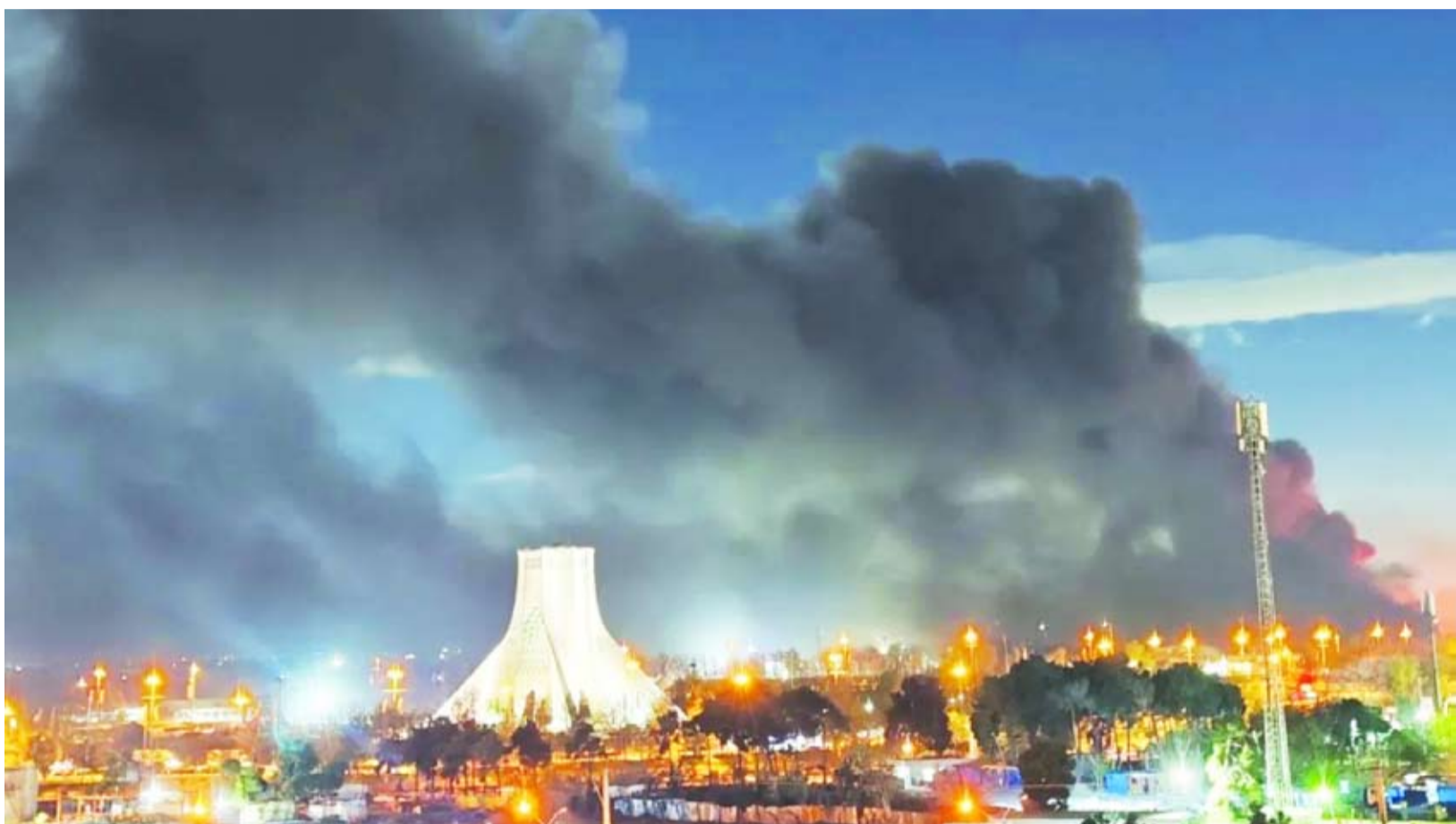
دخان يتصاعد من مطار مهر آباد

كشفت وسائل إعلام أمريكية معلومات جديدة حول مستجدات ومسار المفاوضات الجارية للتوصل إلى اتفاق لوقف إطلاق النار بين الولايات المتحدة وإسرائيل من جهة، وإيران من جهة أخرى، في إطار مساعٍ لتفادي تصعيد أعتف، مع اقتراب انتهاء المهلة التي حددها الرئيس الأمريكي دونالد ترامب. ونقلت صحيفة نيويورك تايمز عن مسؤولين إيرانيين رفيعي المستوى أن مقترح طهران لإنهاء حربها مع الولايات المتحدة وإسرائيل جاء في 10 نقاط، تضمنت رفع العقوبات عن إيران، والمطالبة بضمانات بعدم تعرضها للهجوم مجدداً، ووقف ضربات إسرائيل على حزب الله. وأشارت إلى أنه -في مقابل ذلك- سترفع إيران الحصار عن مضيق هرمز، وستفرض رسوماً تقدر بنحو 2 مليون دولار على كل سفينة، يتم تقاسمها مع سلطنة عمان التي تقع على الجانب الآخر من المضيق. ووفقاً للمسؤولين الإيرانيين، فإن طهران ستستخدم حصتها من العائدات لإعادة إعمار البنية التحتية التي دمرتها الضربات الأمريكية والإسرائيلية، بدلاً من المطالبة بتعويضات مباشرة. وتكثف استهداف منشآت إيران، مع اقتراب نهاية المهلة التي حددها الرئيس الأمريكي دونالد ترامب، فيما