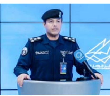
العبيد ناصر بوصليب

القانون بكل حزم فور انتهائها. وأضاف أن الوزارة تلتزم بمبادرة كل من التزم وقام بتسليم ما بحوزته لما يعكسه ذلك من وعي مجتمعي مسؤول وحرص مشترك على تعزيز الأمن والاستقرار ودعم للجهود الوطنية في الحفاظ على سلامة الجميع. وأكد أن المرحلة الراهنة تتطلب من الجميع وعياً واستثنائياً والتزاماً كاملاً بالتعليمات الصادرة. ما لذلك من دور محوري في دعم الجهود الأمنية وتمكين الجهات المختصة من أداء مهامها بكفاءة مشدداً على أن أمن الوطن مسؤولية مشتركة وبأن التعاون الصادق والالتزام المسؤول يشكلان الركيزة الأساسية لعبور هذه المرحلة بثبات وثقة. وسال الله تعالى أن يحفظ الكويت قيادة وشعباً ويديم عليها نعمة الأمن والاستقرار.