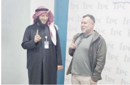
إشهار إسلام أحد المهتدين