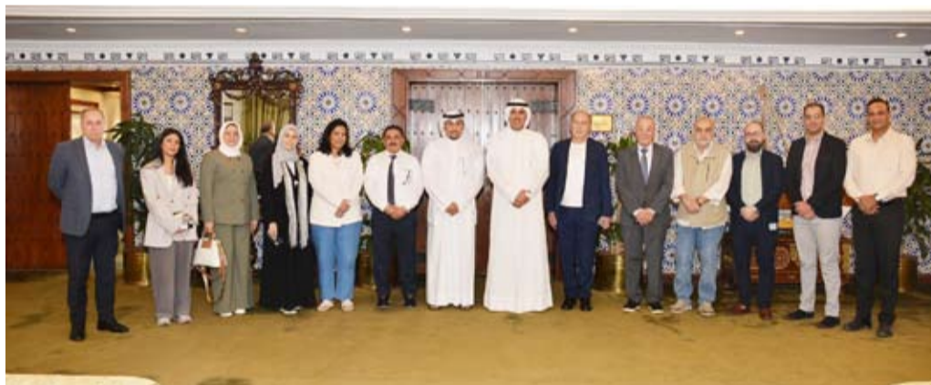
محافظ الأحمد خلال اجتماعه بمسؤولي الشركات وممثل وزارة الصحة

المحيطة به، وفي ختام الاجتماع ثمن محافظ الأحمد كافة الجهود المبذولة للانتهاء من تنفيذ هذا المركز الحيوي الذي سيخدم مرضى الكلي في محافظة الأحمد وباقي مناطق دولة الكويت.